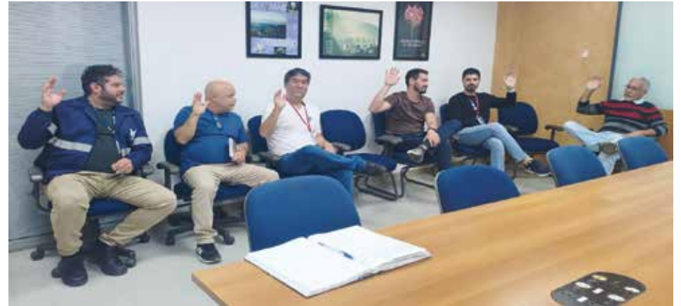
Os empregados da Cetesb terão 3,74% de reajuste nos salários e benefícios

algumas medidas positivas para os companheiros, como o pagamento retroativo a outubro referente à evolução por competência, que será feito na folha de pagamento do final de julho.