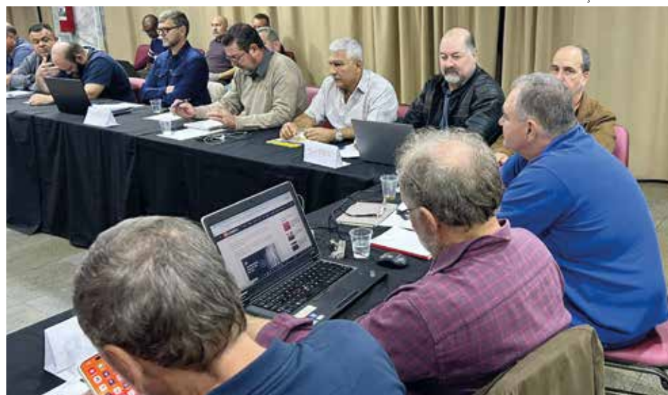
Os companheiros da CPFL querem um ACT com validade de dois anos