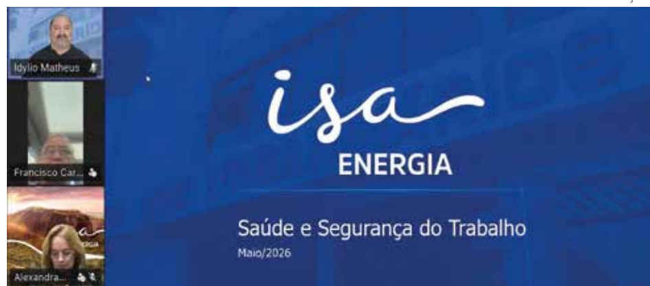
A reunião online com representantes da empresa ocorreu no dia 28 de maio

O relatório apresentado aos sindicatos evidenciou o volume expressivo de operações, com mais de 19 milhões de horas trabalhadas por um