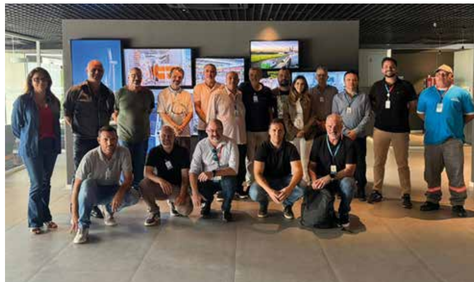
O mandato dos novos integrantes do comitê da CPFL é de três anos

Para o Sindicato, a presença no comitê é fundamental para fortalecer a fiscalização sobre a aplicação dos recursos, ampliar a transparência na gestão e garantir a defesa dos interesses dos trabalhadores, aposentados e demais participantes dos planos.