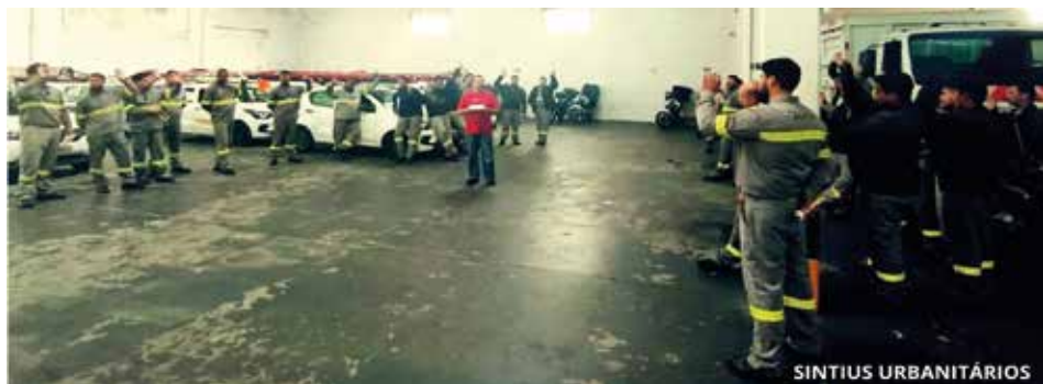
Categoria também pleiteia o pagamento da Cesta de Natal e aumento real

Nesse caso, a pauta estabelece ajuda de custo mensal de R$ 550,00 para despesas com internet e energia elétrica, além da garantia de manutenção integral dos benefícios aos trabalhadores que atuarem em regime remoto.