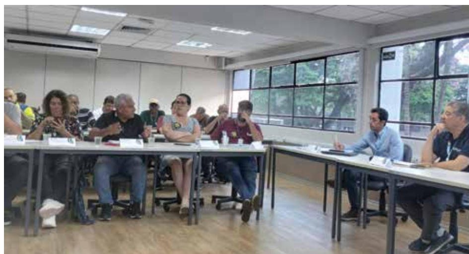
Diretoira do Sintius reagiu com indignação à proposta apresentada pela Sabesp

Na avaliação do Sintius e das demais entidades sindicais, o conjunto das medidas evidencia uma política de corte de direitos e de priorização de resultados financeiros, em detrimento dos trabalhadores que sustentam as atividades da companhia.