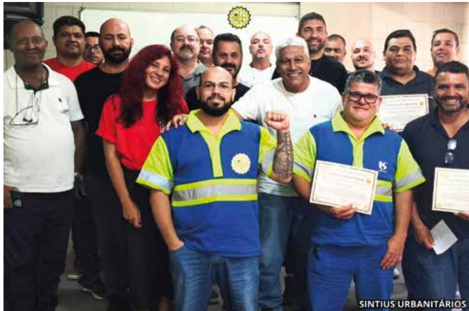
A posse dos novos representantes sindicais ocorreu no dia 13 de março

Segundo a docente, compreender os desafios enfrentados ao longo do tempo é fundamental para ampliar a participação dos urbanitários e avançar na conquista de novos direitos.