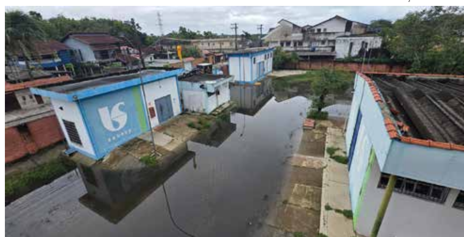
O pátio da ETE Bertioga sempre fica alagado por esgoto bruto

A empresa acrescentou que está em andamento a aquisição de mais duas bombas para reforçar a capacidade do sistema durante chuvas intensas, além de inspeções para identificar ligações irregulares de águas pluviais. A Sabesp também informou que estão previstas obras de ampliação e modernização da ETE, com início programado para março.