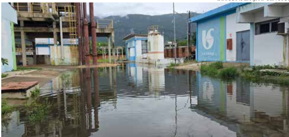
O extravasamento de esgoto afeta o dia a dia dos trabalhadores da unidade da Sabesp