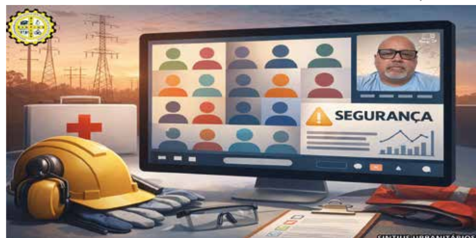
A reunião de saúde e segurança da CPFL ocorreu no dia 28 de janeiro

Durante o encontro, foi apresentada a proposta de como a Norma Regulamentadora (NR-1), que busca garantir maior proteção à saúde mental dos trabalhadores, passará a ser implementada, pois as alterações passam a entrar