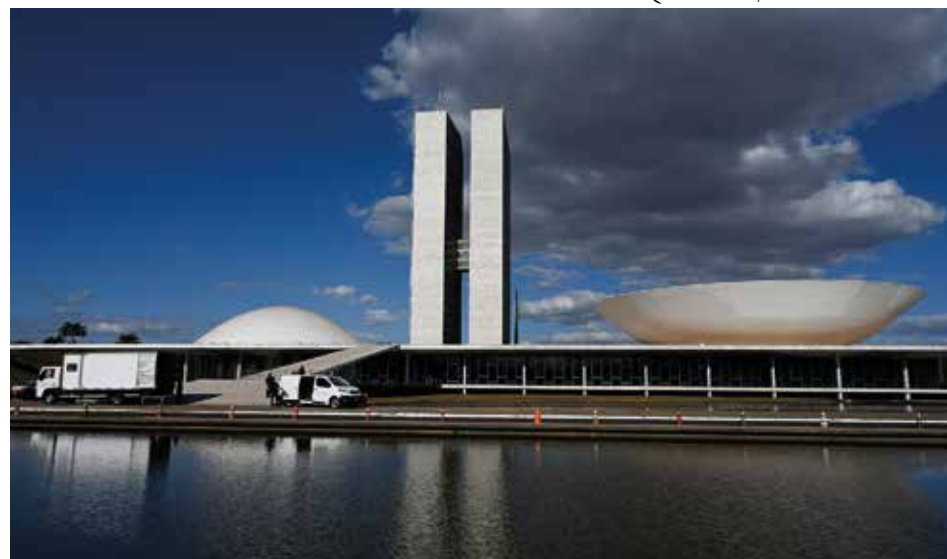
O Congresso Nacional voltou do recesso no dia 1º de fevereiro

avancar em uma agenda que responda às demandas da sociedade brasileira.