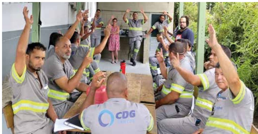
Os companheiros da CDG aprovaram novo Acordo Coletivo, em março