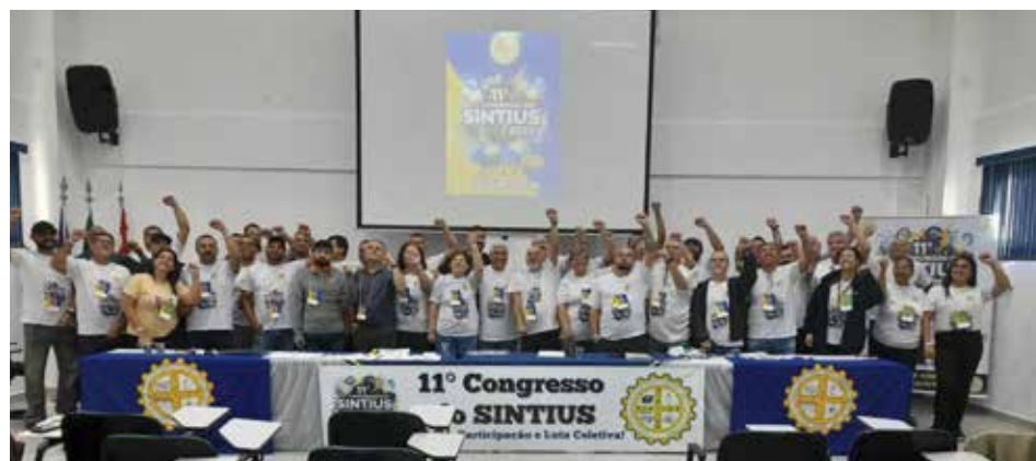
Praia Grande recebeu o 11º Congresso dos Urbanitários realizado em agosto