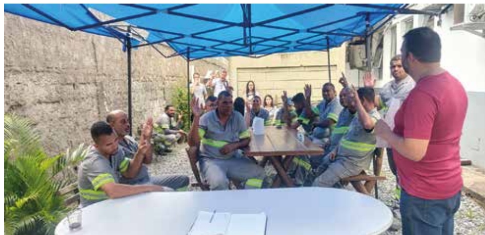
Diretoria apresentou em assembleia os principais pontos do acordo da PLR em fevereiro de 2026.

Os valores serão depositados para os empregados em uma única parcela