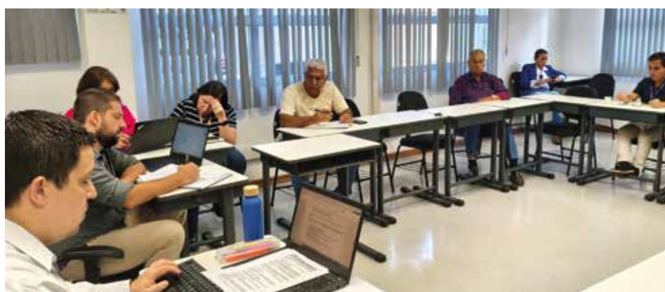
Diretoria cobrou avanços no ACT da Cetesb durante a campanha salarial