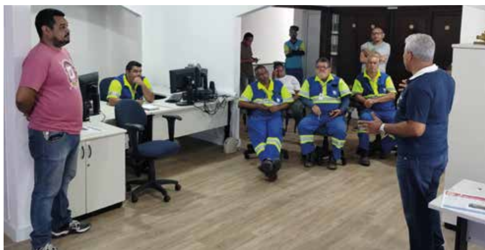
Sindicato intensificou o contato com a base por meio das reuniões setoriais