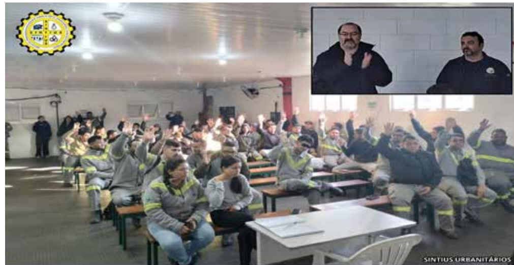
Os diretores do Sindicato estiram mais presentes ouvindo as demandas da B. Tobace

No âmbito da ISA Energia Brasil, o Sintius participou de discussões sobre o Projeto Ômega, que reorganizou funções e impactou áreas técnicas da empresa. No fim do ano, a Diretoria ajuizou uma ação por prática antissindical contra a empresa, após a demissão de um trabalhador que era