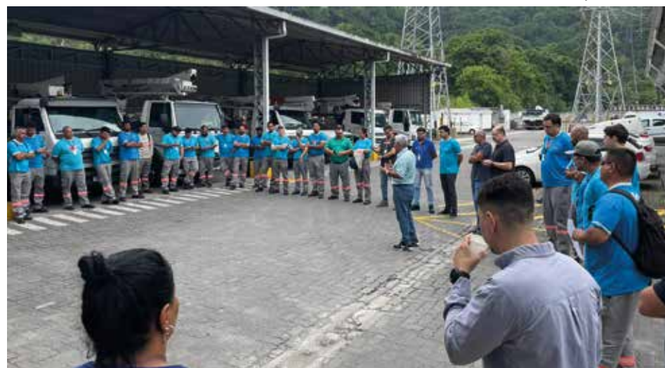
Diretoria do Sintius realizou reunião setorial na EA Santos em dezembro

Em 25 de dezembro e 1º de janeiro não haverá atendimento ao público. Ao todo, serão acumuladas 16h a serem compensadas pelos trabalhadores ao longo do primeiro trimestre de 2026, em datas que serão definidas e informadas pela gestão local de cada agência.