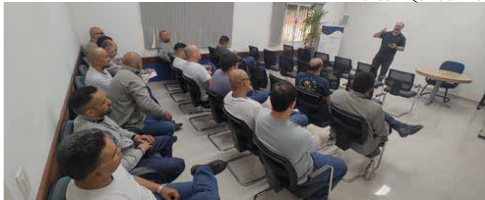
Diretoria discute a proposta de ACT com os companheiros da ISA Energia Brasil