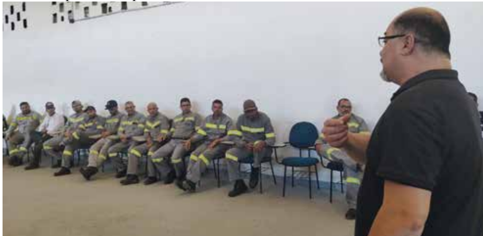
Trabalhadores da Start buscaram auxílio do Sintius para ter um melhor plano de saúde

Estamos chegando à metade do mandato desta Diretoria. Foram dois anos de uma gestão marcada por firmeza, diálogo e compromisso. Renovamos nosso agradecimento a cada companheira e companheiro que caminhou ao lado do Sintius nesse período tão desafiador. Em 2025, enfrentamos momentos decisivos para o futuro da nossa categoria, para a defesa dos empregos e para a valorização da classe trabalhadora. Mais uma vez, mostramos que a união é capaz de transformar resistência em conquistas concretas.