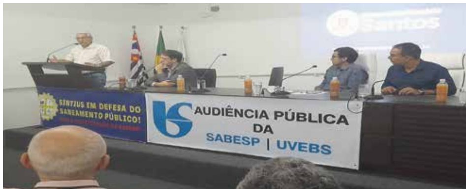
Após provocação do Sintius, a União dos Vereadores discutiu os problemas da Sabesp