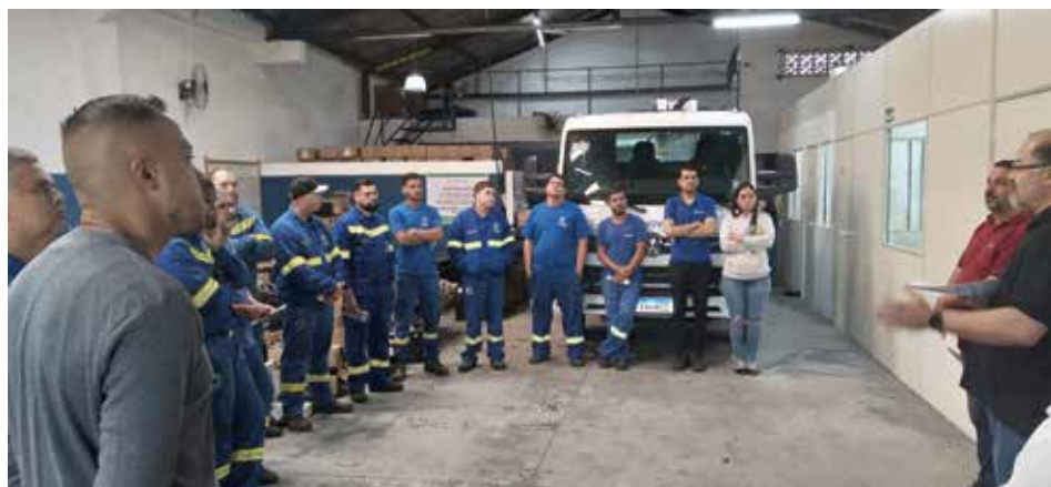
Sindicato passou a representar os trabalhadores da Nova Luz, em Praia Grande