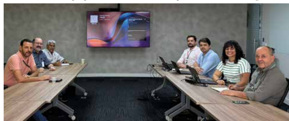
Sindicato apresentou demandas à CPFL durante as reuniões do Diálogo Social