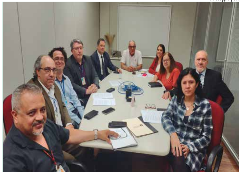
A reunião entre o Sindicato e a Sabesp sobre o tema ocorreu em 25 de outubro

Trabalhadores da B. Tobace aprovam novo ACT e conquistam reajuste salarial de 12,79% P.5