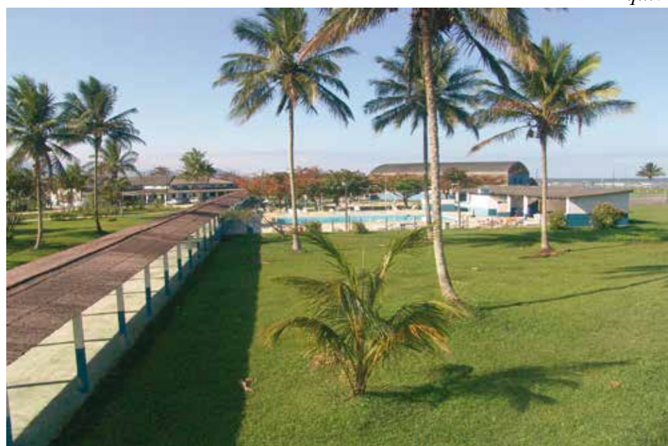
A colônia é uma excelente opção de lazer para os trabalhadores e familiares