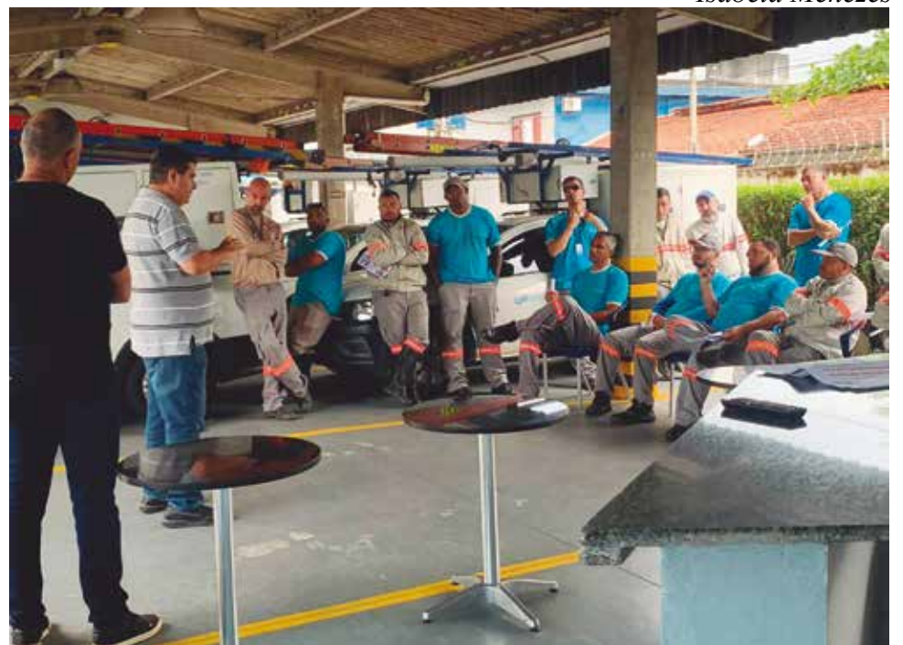
As conversas com os trabalhadores da CPFL ocorreram no mês de outubro