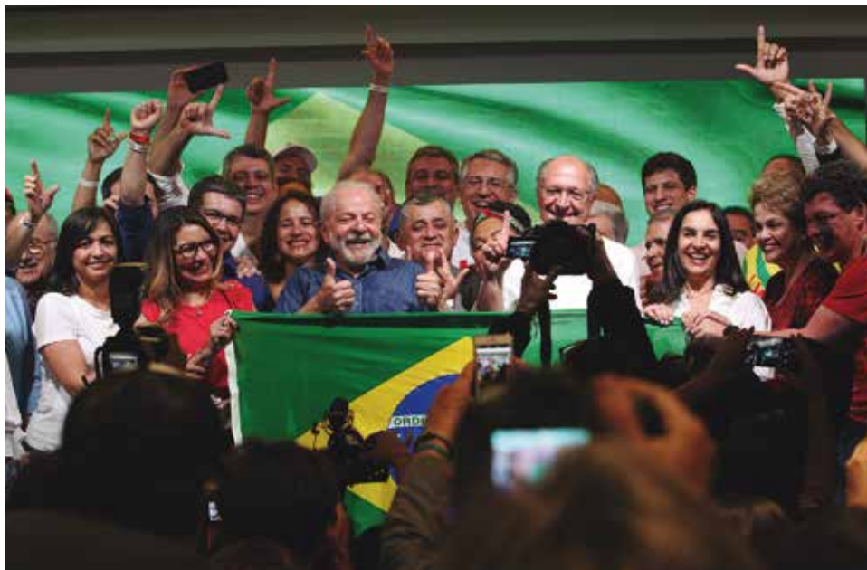
O petista venceu a eleição ao obter 50,9% dos votos válidos no 2º turno decidiram votar.

Em seu primeiro discurso como vencedor das eleições presidenciais, o petista se comprometeu em montar