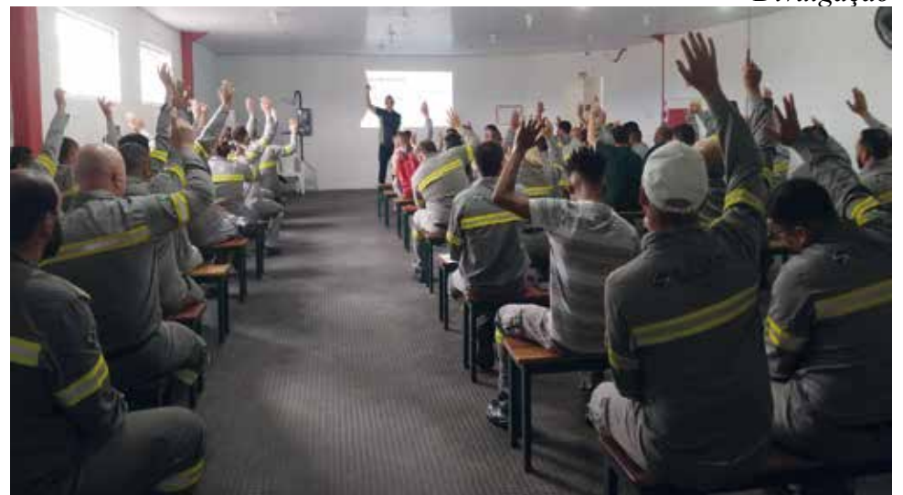
Os trabalhadores aprovaram o novo Acordo Coletivo por unanimidade