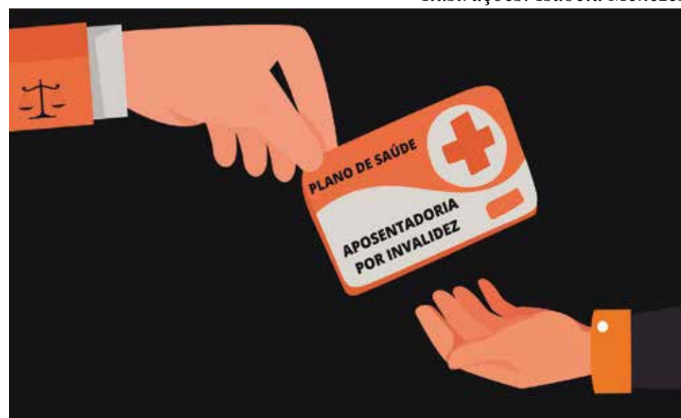
Ilustrações: Isabela Menezes

A empresa alegou que o trabalhador já tinha problema no joelho, contudo, o agravamento de uma doença no exercício do trabalho também é considerado acidente de trabalho e a empre-