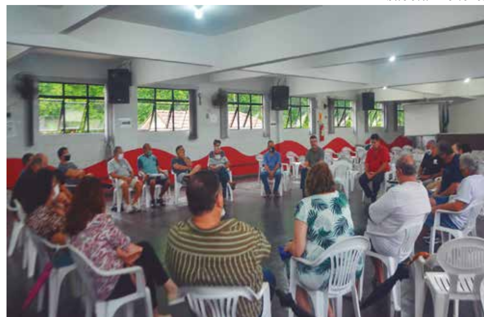
A reunião com os beneficiários do PSAP/Cteep ocorreu no auditório do Sintius

O Sindicato enviou para a Cteep uma carta de repúdio por tama-