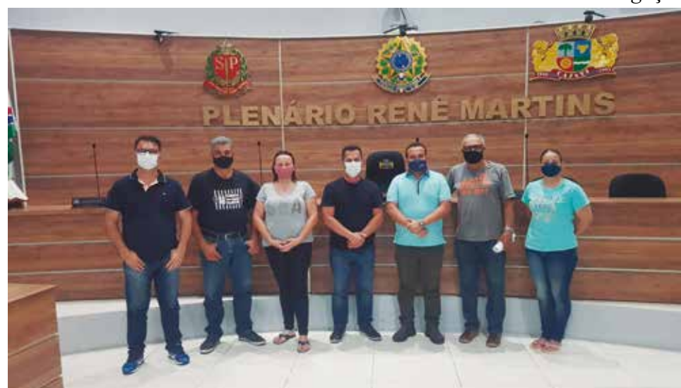
Os vereadores de Cajati abraçaram a causa defendida pelo Sintius