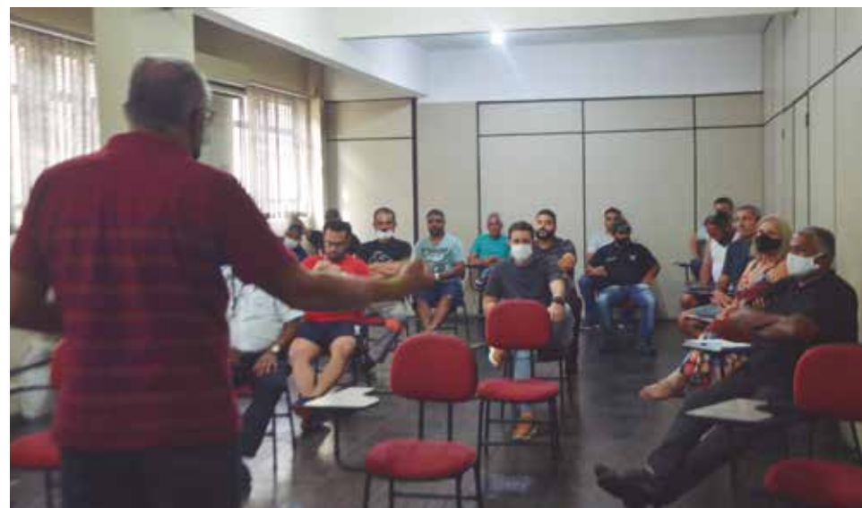
A reunião foi realizada no miniauditório da sede do Sintius, em 25 de março

Na reunião, houve destaque para a relação da Secretaria de Comunicação com a atuação dos representantes sindicais, que recebem diariamente um boletim informativo com as principais notícias do dia relacionadas ao universo trabalhista, bem como ser uma fonte de consulta segura as informações mantidas no material impresso e digital divulgados pelo Sindicato de forma física ou através do site e redes sociais.