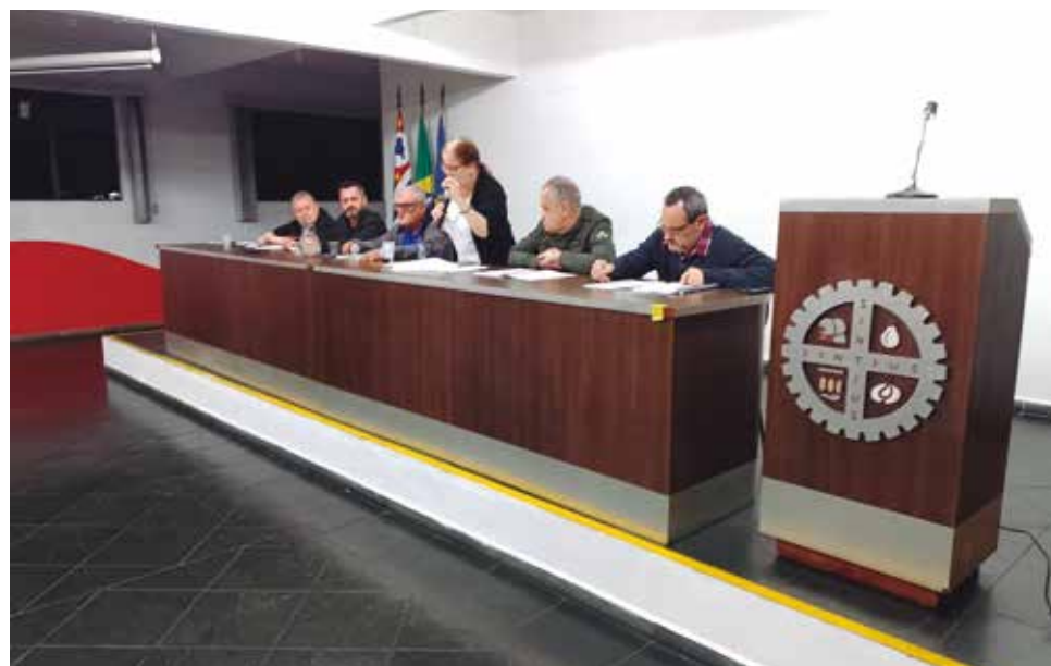
A assembleia com os associados do Sintius ocorreu no dia 29 de setembro