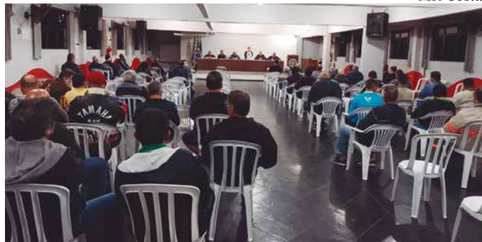
Categoria deliberou sobre as sugestões apresentadas no 10º Congresso

CPFL: Sindicato quer solução para planos de saúde de aposentados por invalidez P.4