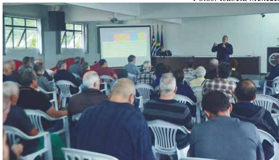
O encontro foi realizado na sede do Sintius, no dia 21 de setembro