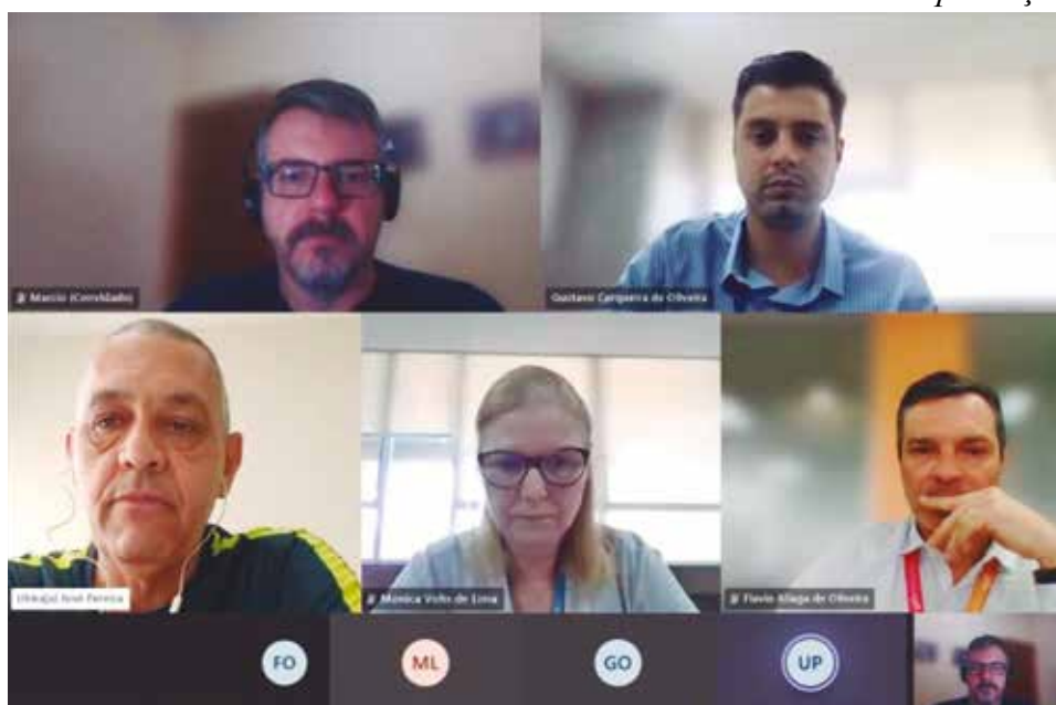
Sintius defende a manutenção do plano de saúde para esses aposentados

Entretanto, para a companhia aplicar esse direito, o Sindicato tem que recorrer à Justiça para que o trabalhador possa utilizar o plano de saúde a que tem direito e as sentenças são favoráveis. E com esse quadro, agravado pelo aumento da procura por este recurso judicial na entidade, o Sintius decidiu solicitar uma