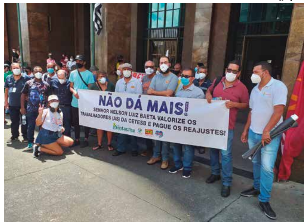
Os sindicatos organizaram um protesto na frente da Secretaria da Fazenda