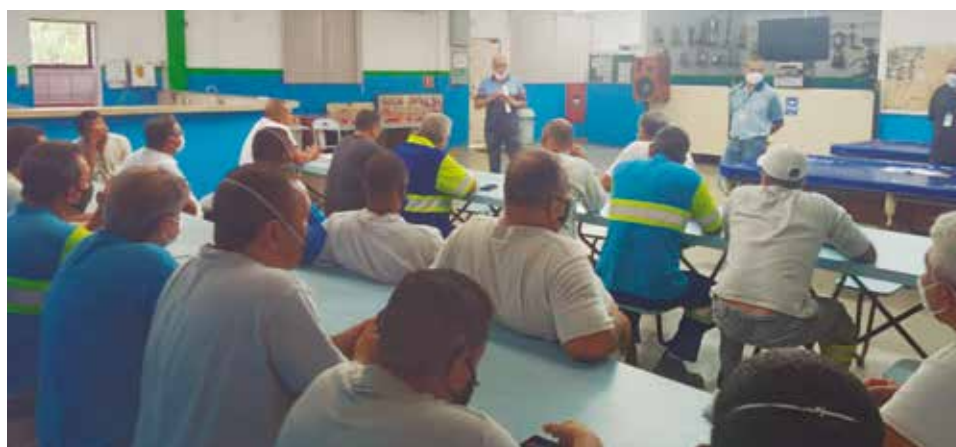
Diretoria dialoga com os trabalhadores da Sabesp na unidade do Saboó

Essas sugestões apresentadas pelos companheiros nesses encontros são muito importantes para que a Diretoria possa elaborar