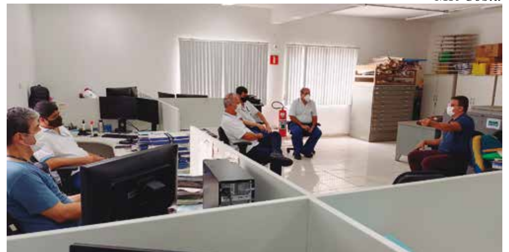
A diretoria do Sintius fez reunião setorial na agência ambiental de Registro