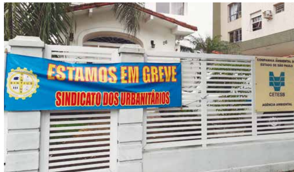
Os trabalhadores da estatal paralisaram as atividades por seis dias em janeiro