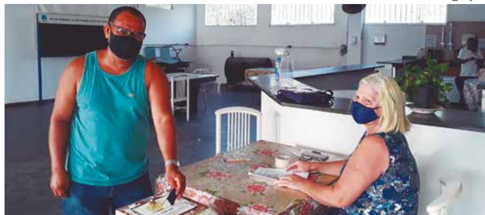
O pleito nos setores de Itanhaém, Bertioga e Guarujá ocorreu no dia 27 de fevereiro