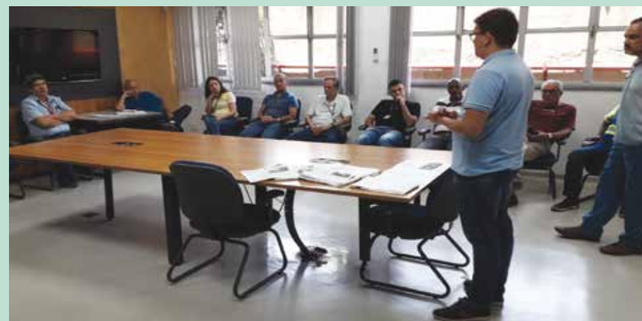
O Sintius discutiu melhorias na pauta com os companheiros de Cubatão e de Santos