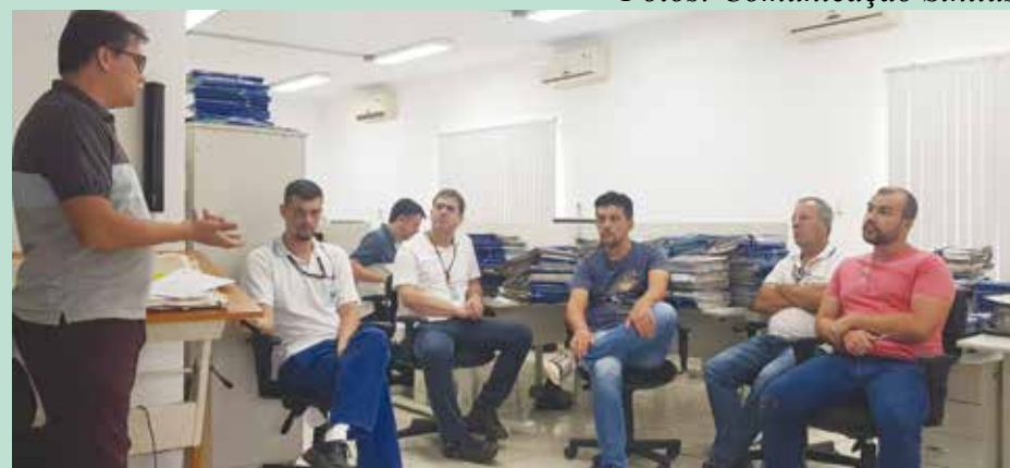
A Diretoria fez assembleia para aprovar a pauta na unidade de Registro