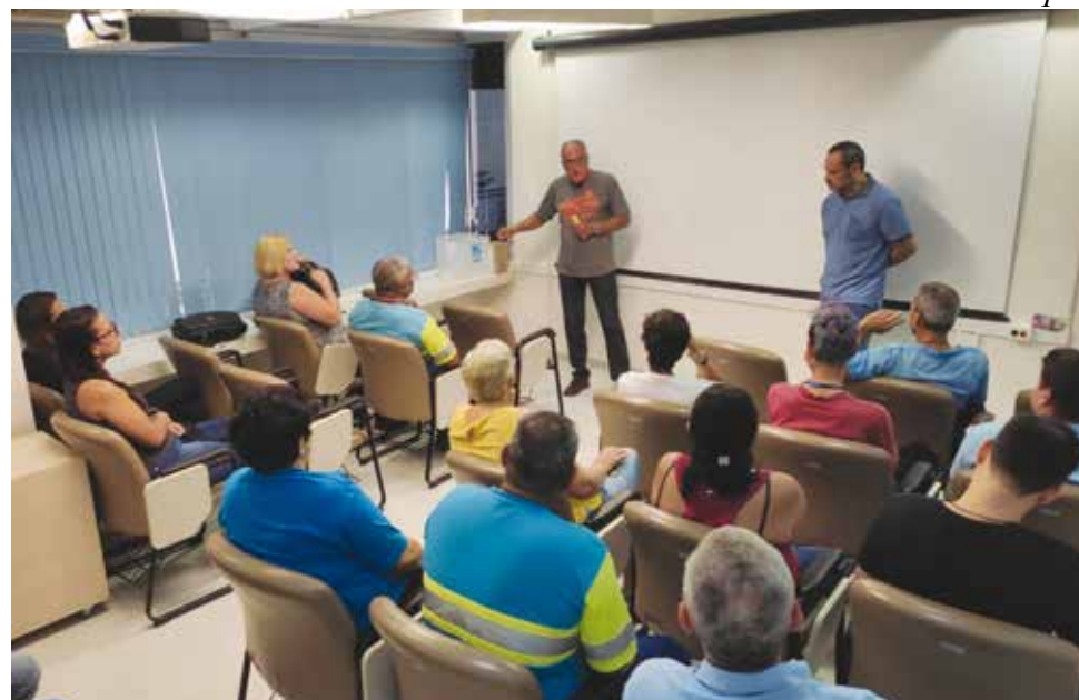
O Sintius está dialogando sobre esse tema com os trabalhadores da Sabesp

Foi verificado que as alterações não afetam a aplicação dos adicionais da categoria.