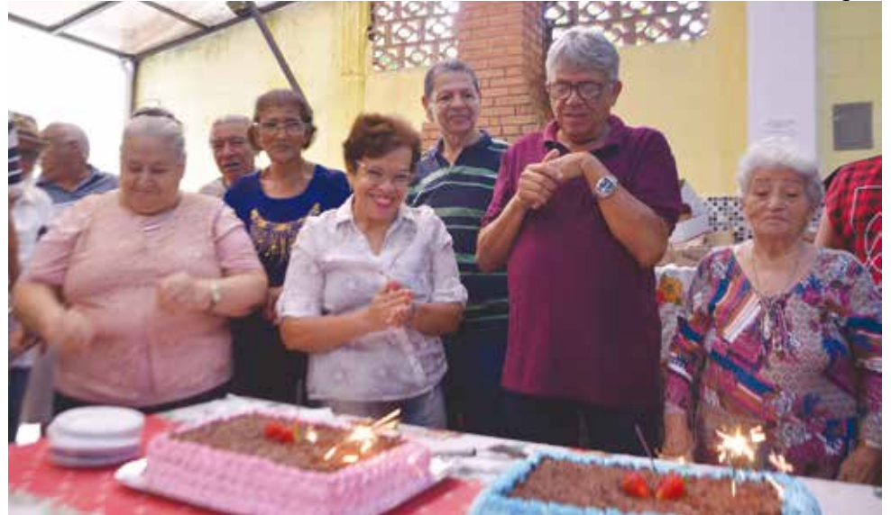
A mais recente celebração na sede do Sindicato ocorreu em 28 de fevereiro

Interessados em ingressar com ações para revisão do valor de aposentadorias e pensões devem procurar o Departamento Jurídico