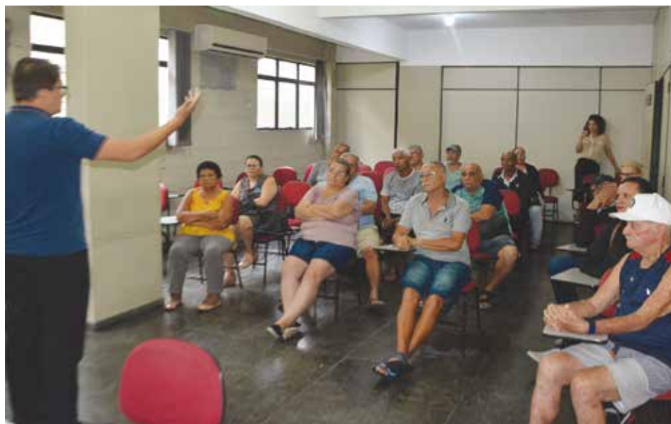
O Sindicato iniciou o pagamento das indenizações no dia 10 de fevereiro

Os associados contemplados nessa ação tiveram um desconto de 30% no valor das indenizações referente aos honorários do advogado Sergio