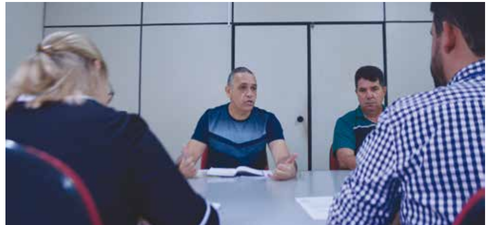
A Diretoria do Sintius foi firme nas cobranças feitas aos gestores da empresa