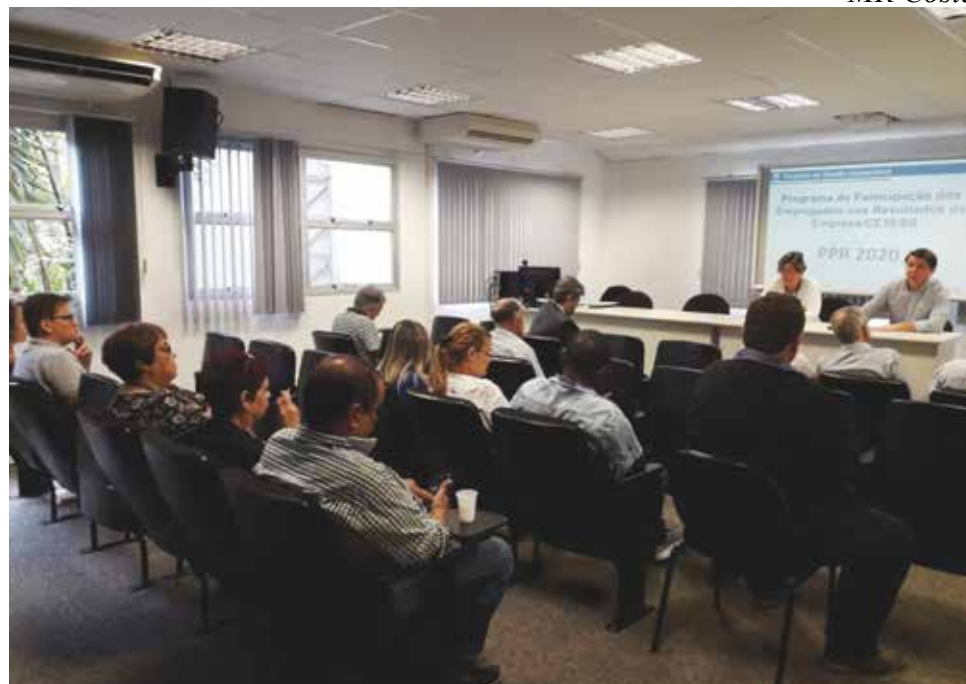
A reunião com os representantes da Cetesb ocorreu no mês de dezembro