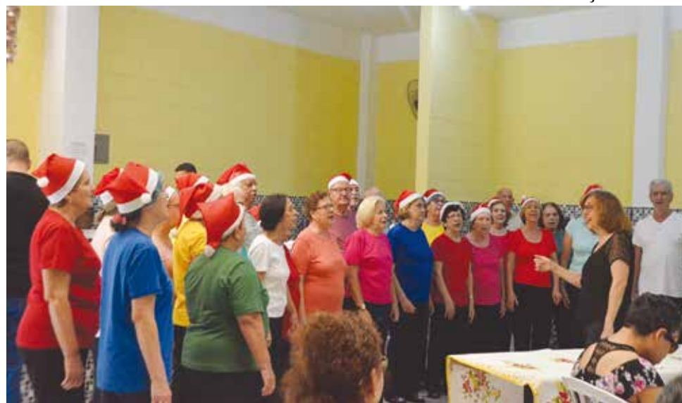
A mais recente celebração na sede do Sindicato ocorreu em 18 de dezembro

Além de cantar e se alimentar bem nessa atividade, os associados aposentados e pensionistas que acompanharam o último evento do ano concorreram a brindes sorteados pela representante da corretora de seguros Porto Seguros.