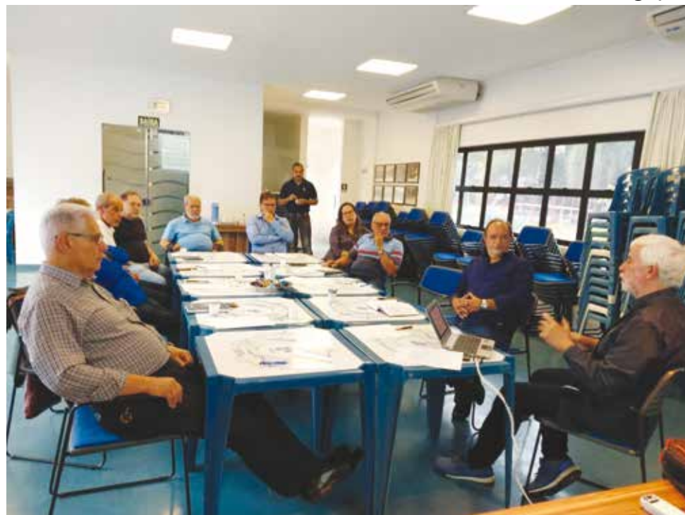
Os representantes das entidades estiveram reunidos no dia 23 de janeiro