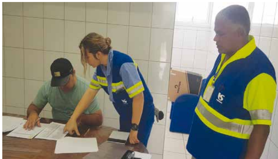
As eleições para representante sindical foram realizadas nos dias 21 e 22 de janeiro