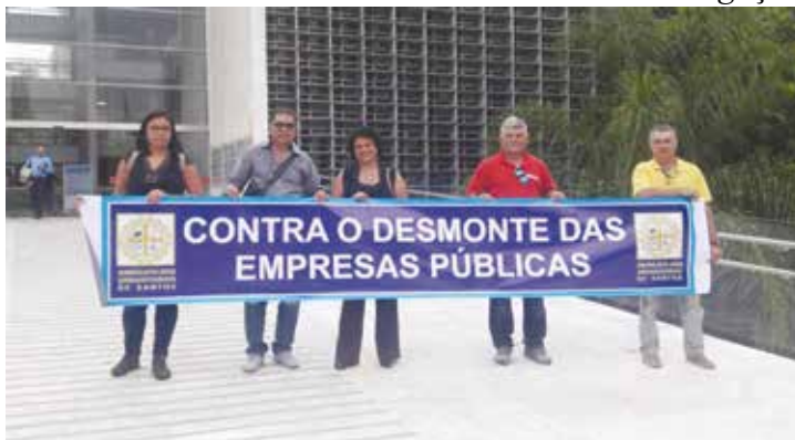
A Diretoria esteve no evento a convite dos deputados estaduais e defendeu que os serviços de saneamento sejam estatizados