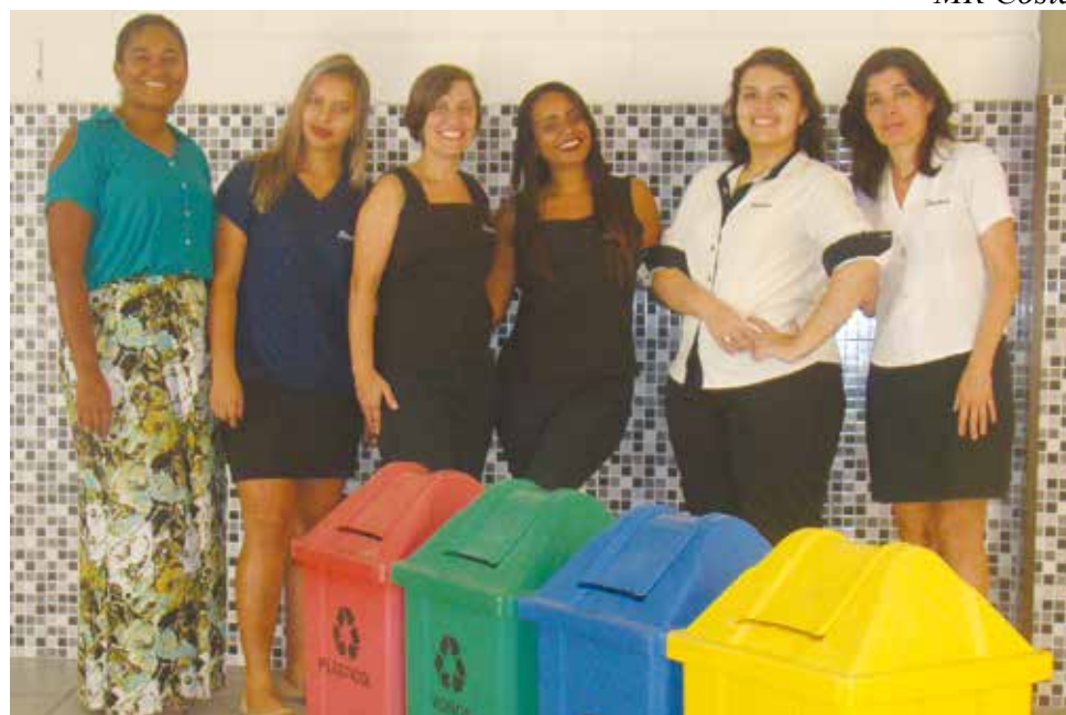
A comissão formada por funcionárias do Sindicato foi criada em janeiro