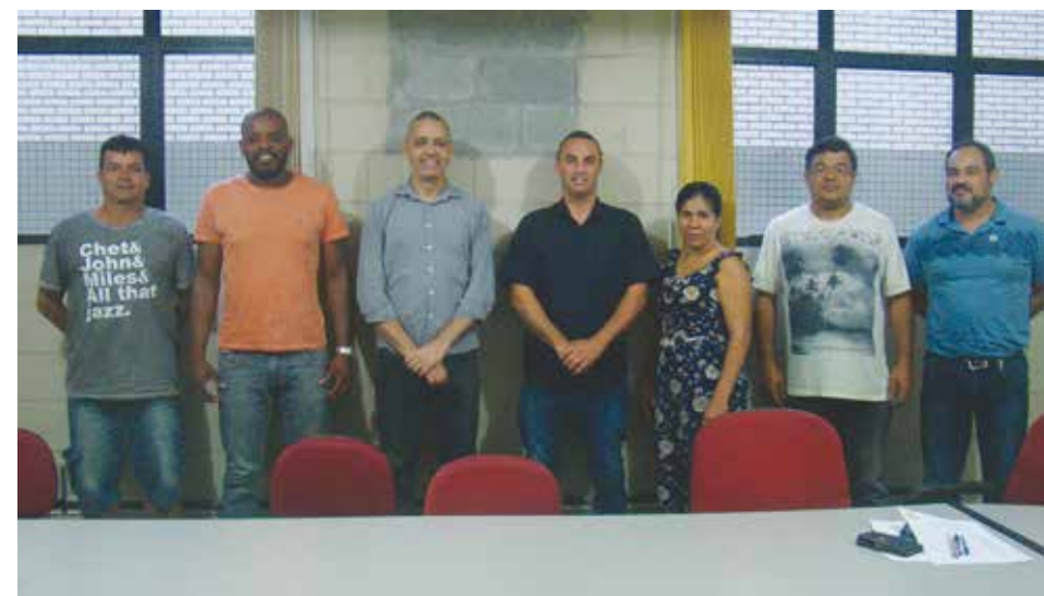
Diretores do Sintius citaram a importância do trabalho do representante sindical para o fortalecimento da categoria e conquista de melhorias aos trabalhadores