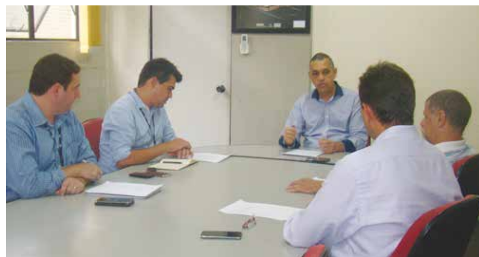
A reunião com representantes da CPFL ocorreu no dia 15 de fevereiro

-se também da qualidade da capa de chuva fornecida, porque o material fica muito ressecado após a utilização, o que dificulta até a dobra para guardá-la. Eles citaram ainda que a empresa está solicitando um suporte na fachada da edificação para fixação da escada, mas os companheiros não têm a garantia que tal suporte está com a sua fixação adequada para suportar o peso colocado sobre ele.