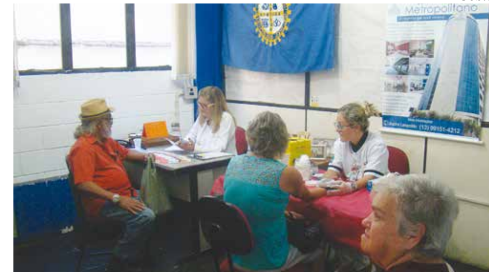
Durante o evento, participantes aferiram a pressão e fizeram teste de glicemia