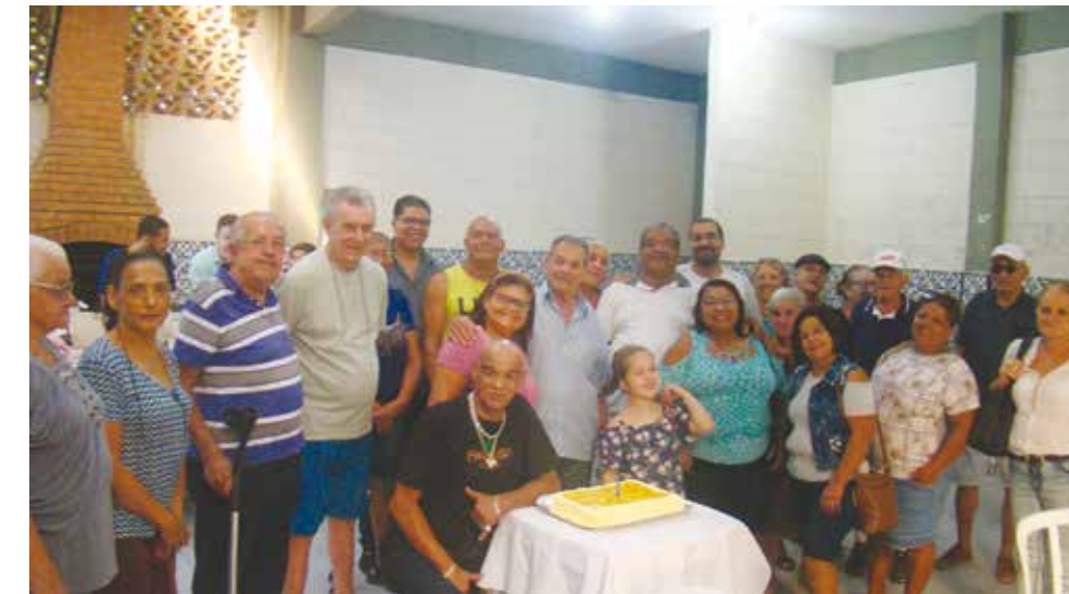
A festa dos aniversariantes de março e abril ocorreu no dia 30 de abril