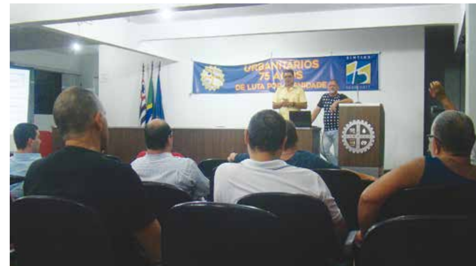
Assembleia sobre Contribuição Assistencial/Confederativa ocorreu em 25 de abril