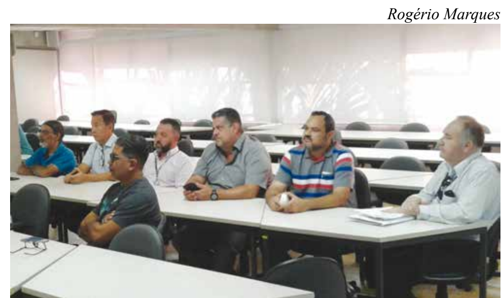
A reunião da Diretoria do Sintius com representantes da Sabesp ocorreu em abril

A Sabesp planeja ainda ampliar o benefício para melhorar a qualificação dos trabalhadores da empresa em todo o Estado. A ideia é financiar até 70% dos custos de cursos relacionados à atividade exercida, desde o nível básico ao universitário.