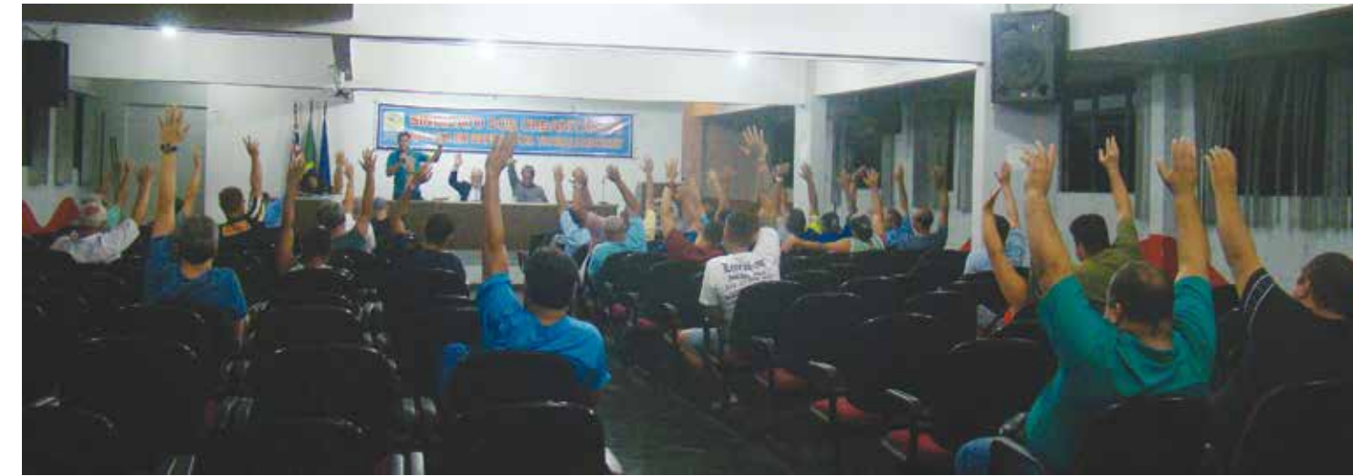
Os trabalhadores da Sabesp reivindicam que o próximo Acordo Coletivo de Trabalho tenha validade de dois anos

Os trabalhadores e a Diretoria do Sintius consideraram uma afronta a proposta da empresa para rebaixar conquistas históricas, como a diminuição do adicional de turno de 15% para 7%, redução da garantia no emprego de 98% do efetivo para 95%, restrição da hora-extra da prorrogação de jornada de 100% para 50% e implantação da escala de revezamen-