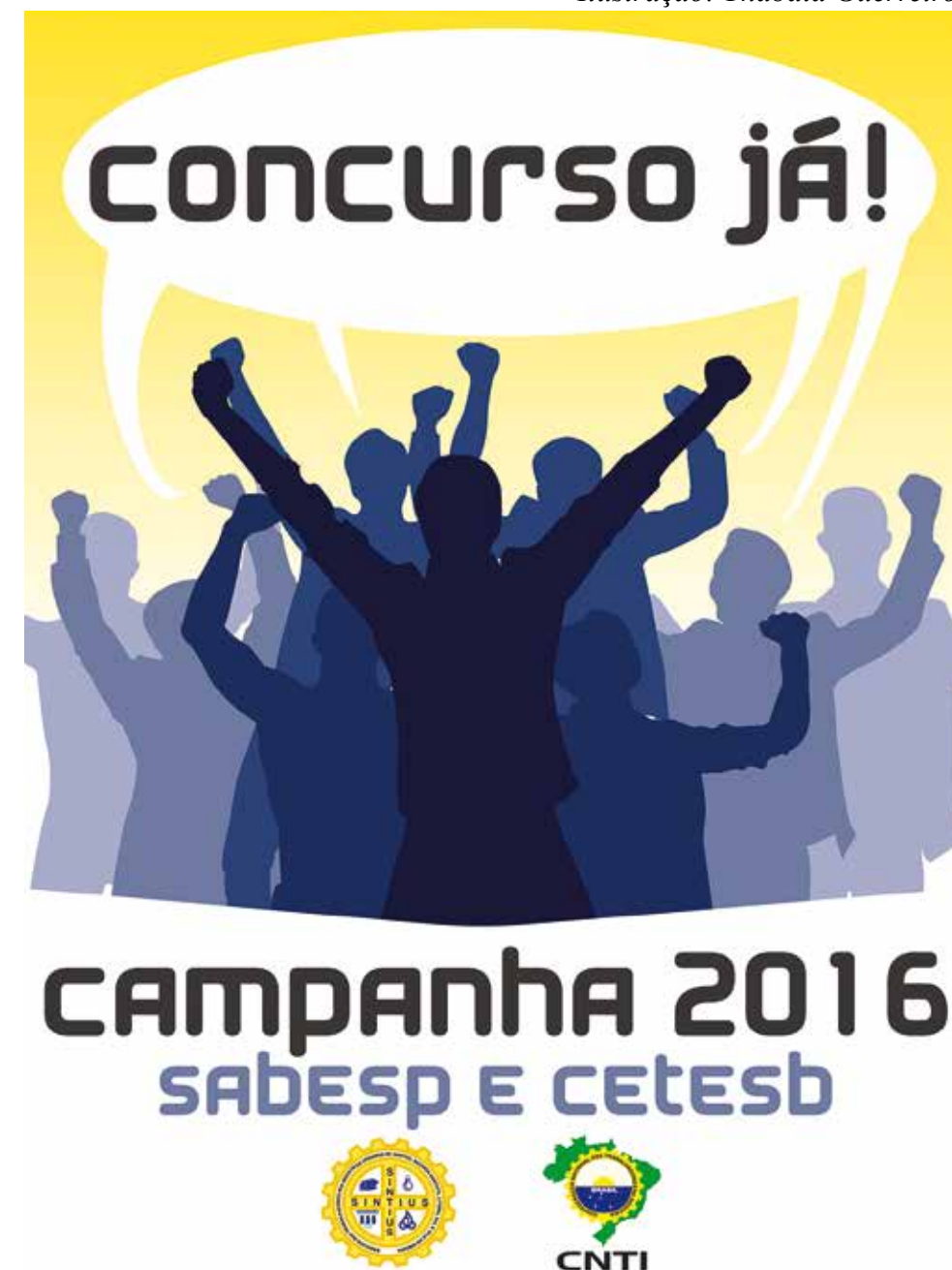
Ilustração: Thabata Guerreiro

A atual Diretoria exige a realização de concursos públicos desde o início da gestão