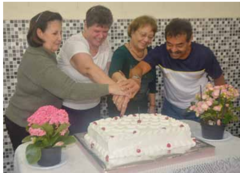
A festa de agosto ocorreu somente no dia 11 de setembro

Em razão das diversas ações promovidas pela direção do Sintius, a Sabesprev acabou revendo seus procedimentos, não excluindo mais os aposentados por invalidez do plano.