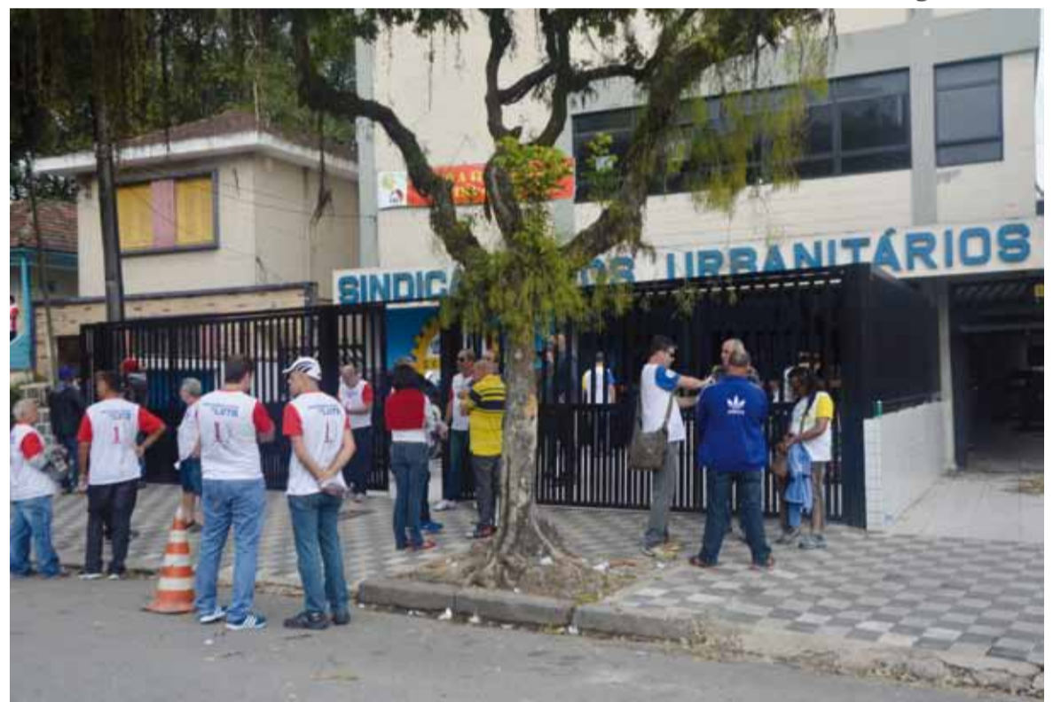
A eleição do Sindicato ocorreu dentro da normalidade, assim como nos anos anteriores

A chapa 2 - Transparência Urbanitária também foi a mais votada na disputa para o Conselho Fiscal do Sintius. O grupo recebeu 719 votos contra 484 da chapa 1 - Res-