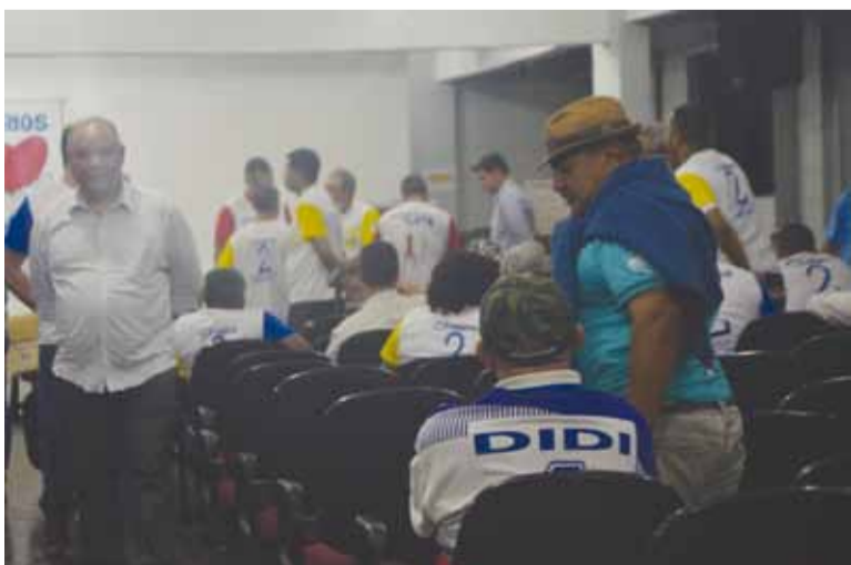
A apuração dos votos da eleição ocorrida nos dias 2 e 3 deste mês teve o acompanhamento de chefias da Sabesp

A atual diretoria do Sintius parabeniza os 1.297 associados da ativa e aposentados que compareceram às urnas da Baixada Santista e Vale do Ribeira no início deste mês para definir os rumos do Sintius para os próximos anos.