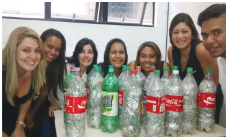
O material foi entregue para a Sabesp durante o mês passado

Participe desta importante campanha, deixando na sede do Sintius os lacres das latinhas. Fazer o bem revigora a alma!