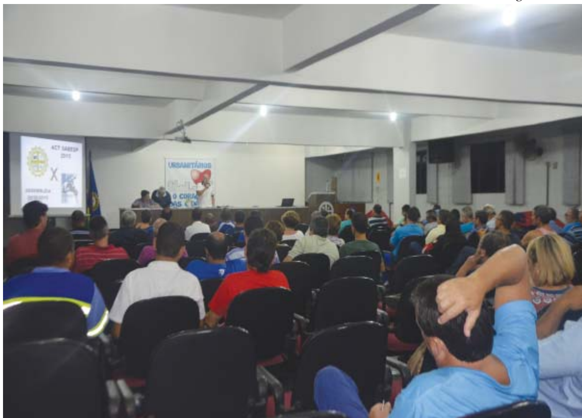
A categoria aceitou, por unanimidade, os termos sugeridos pelo TRT e acatados pela Sabesp