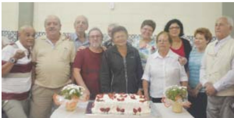
A festa do mês de maio foi celebrada no dia 1º de junho

O Sintius comemora o aniversário dos aposentados e pensionistas de junho no dia 26. Para celebrar essa data, será feito um grande café da manhã, a partir das 9h30, no salão de festas do Sintius. Todos os aniversariantes aposentados e pensionistas deste mês estão convidados a participar dessa festa, assim como os respectivos familiares.