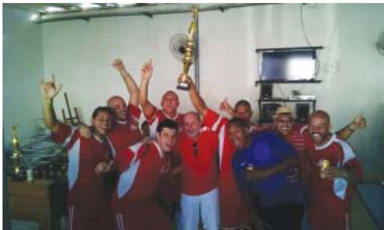
Na final, o time de Guarujá levou a melhor e ficou com a taça

Todos os aniversariantes aposentados e pensionistas deste mês estão convidados a participar dessa festa, assim como os respectivos familiares. Contamos com a sua presença no próximo dia 31.