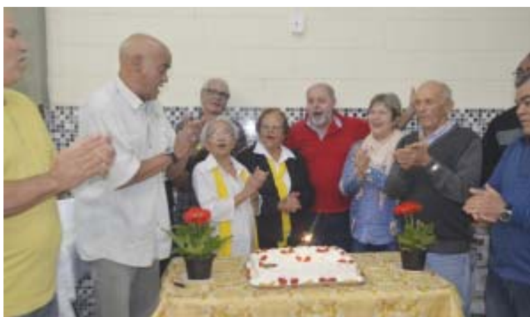
A festa do mês de junho foi celebrada no último dia 26