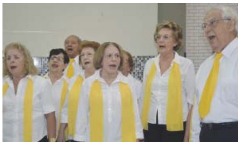
Evento contou com a animação do Coral A Voz dos Urbanitários