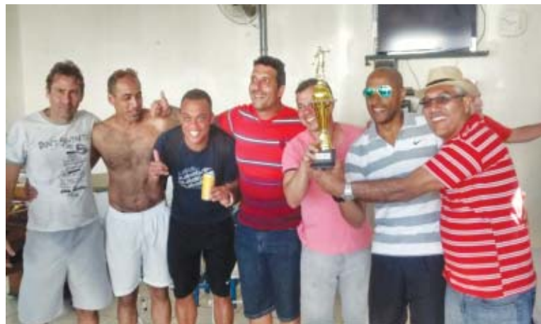
O festival foi disputado na Associação Sabesp, no último dia 27