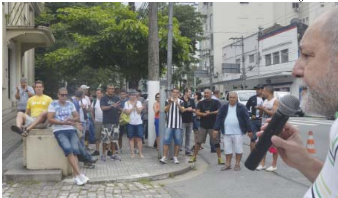
A Sabesp reconheceu a legalidade da paralisação e não descontou o ponto dos trabalhadores