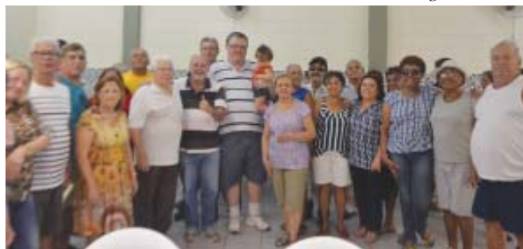
A confraternização do mês passado ocorreu no último dia 24

O Sintius comemora o aniversário dos aposentados e pensionistas de maio no dia 29. Para celebrar essa data, será feito um grande café da manhã, a partir das 9h30, no salão de festas do Sintius. Todos os aniversariantes aposentados e pensionistas deste mês estão convidados a participar dessa festa, assim como os respectivos familiares.