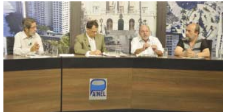
A questão previdenciária foi debatida no programa Painel Regional