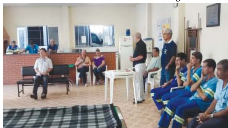
Em reunião setorial realizada em Praia Grande, a Diretoria do Sindicato destacou a necessidade de união da categoria