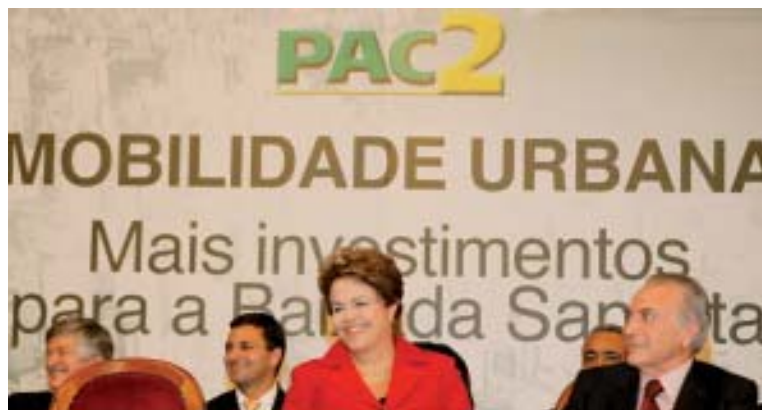
Essa foi a primeira visita oficial de Dilma à Baixada Santista

consórcio é iniciar uma negociação sobre as reivindicações dos trabalhadores e discutir o reajuste salarial da categoria.