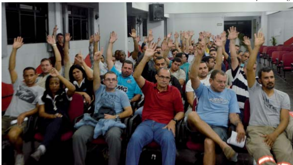
Um bom número de trabalhadores compareceu ao Sintius para aprovar a nova proposta da empresa

O Sindicato parabeniza a categoria pela maturidade e participação nas discussões do novo ACT. A unidade fez a diferença novamente para se chegar a um bom resultado sem a necessidade de greve.