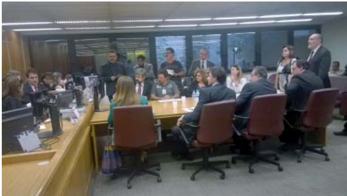
Durante a reunião no TRT, em São Paulo, a Cetesb avançou em alguns itens defendidos pelo Sintius