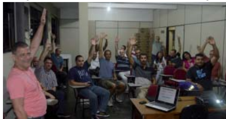
A assembleia de prestação de contas ocorreu no último dia 25

O Conselho Fiscal do Sintius deu parecer favorável às contas. A apresentação desse balanço financeiro está prevista no Estatuto do Sindicato, sendo obrigatória a sua realização até o 31 de julho do ano subsequente.