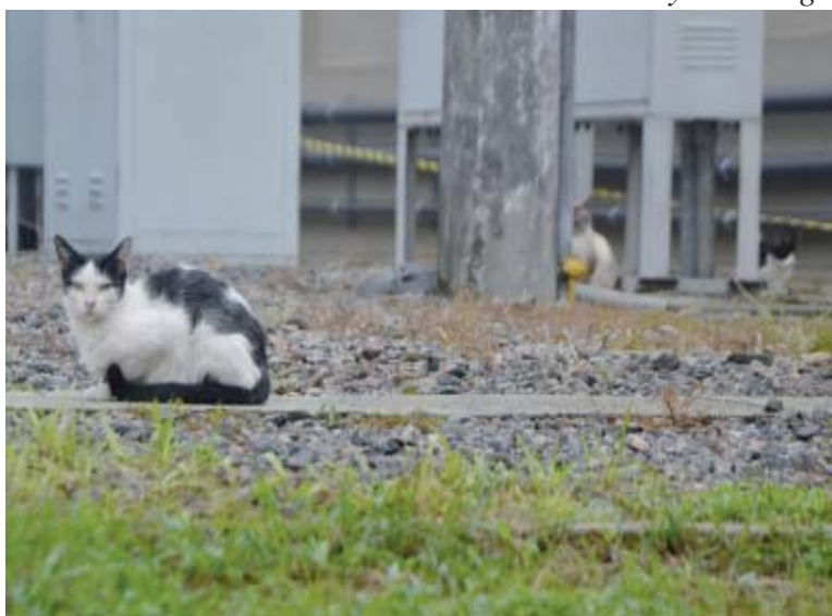
Ao entrar na unidade, é possível observar vários gatos no local

Há muito tempo o Sintius vem alertando a empresa sobre o total estado de abandono e a falta de segurança nas estações de energia na Cidade. A cada reunião com a empresa, a direção do Sin-