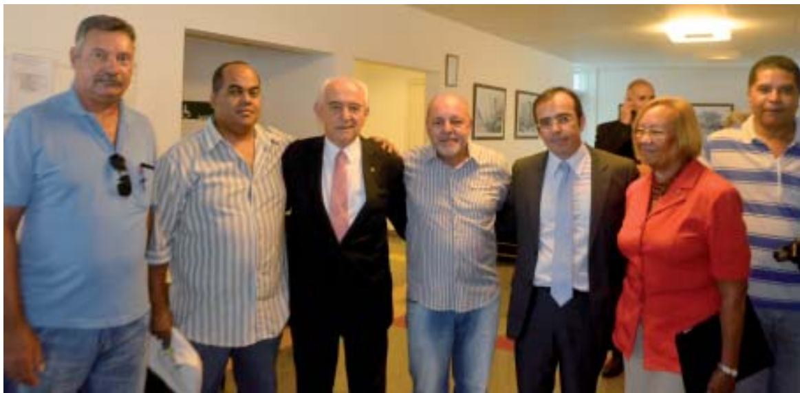
Após reunião na Gerência Regional do Trabalho, Diretoria esteve com o ministro na Câmara de Santos

Além disso, aproveitou a chance para convidar Dias a retornar à Cidade para que os sindicatos locais apresentem reivindicações e sugestões para beneficiar os trabalhadores.