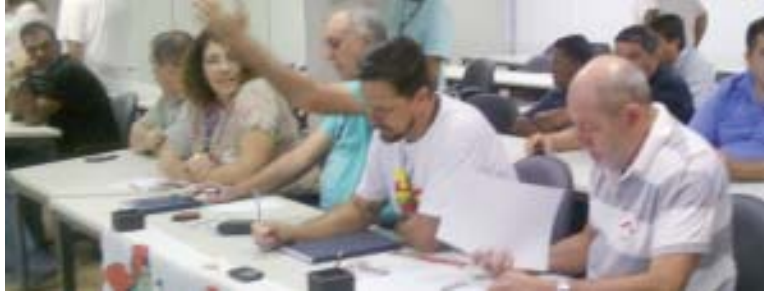
Alteração ocorreu com base em um trabalho feito por uma empresa

Com o fim dos enquadramentos nos GHE, na base do