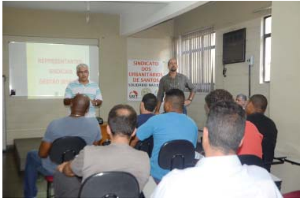
No evento, foram discutidos temas, como formação sindical e análise de conjuntura