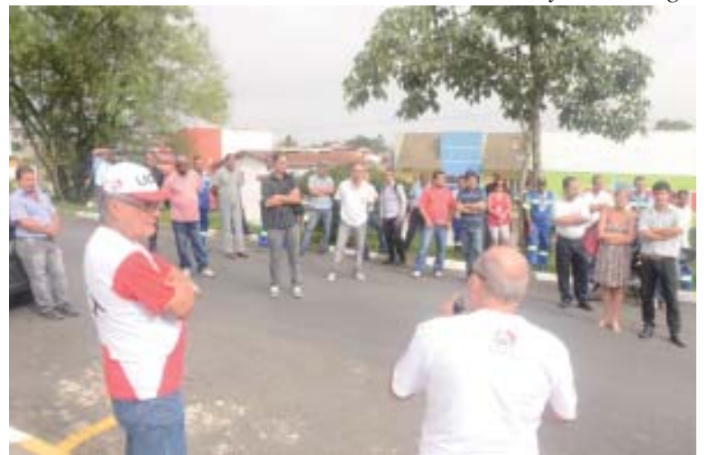
A greve no Vale do Ribeira teve adesão de 100% da categoria, que deu um exemplo de unidade e de disposição para a luta