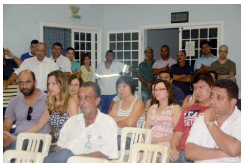
Os trabalhadores do Vale do Ribeira compareceram em peso nas assembleias realizadas pelo Sintius em Registro