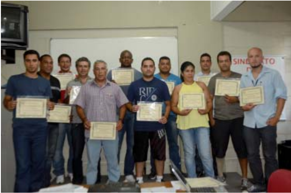
A posse dos novos representantes sindicais ocorreu no dia 27 de fevereiro