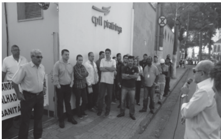
O protesto do Sindicato foi realizado no dia 18 de abril

Durante a reunião na GRTE, a CPFL Piratininga se comprometeu a implantar o Plano de Cargos e Salários até o final de maio, ainda na vigência do atual ACT.