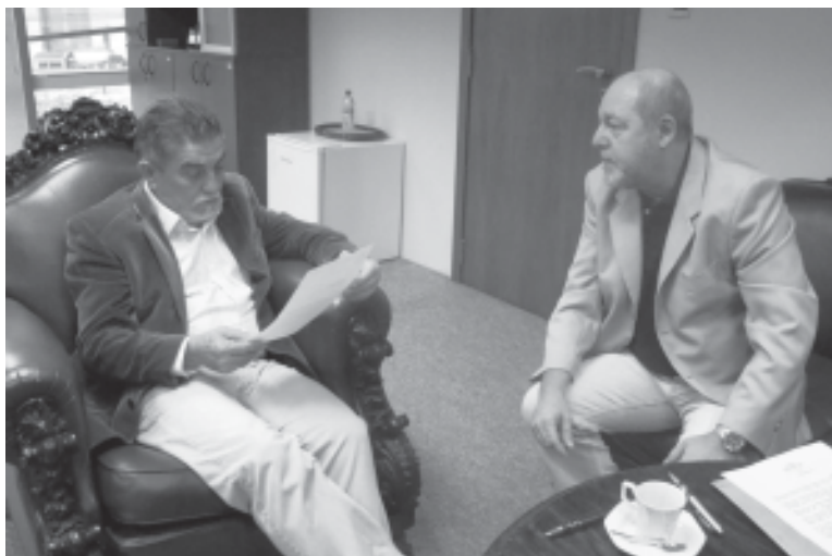
Ortiz ficou de estudar as reivindicações elaboradas pelo Sintius

“Queremos que as metas sejam objeto de negociação, assim como a forma de distribuição do montante acordado. Dessa forma, buscamos uma livre negociação, com o objetivo claro de chegar a um bom termo no ACT”, destacou.