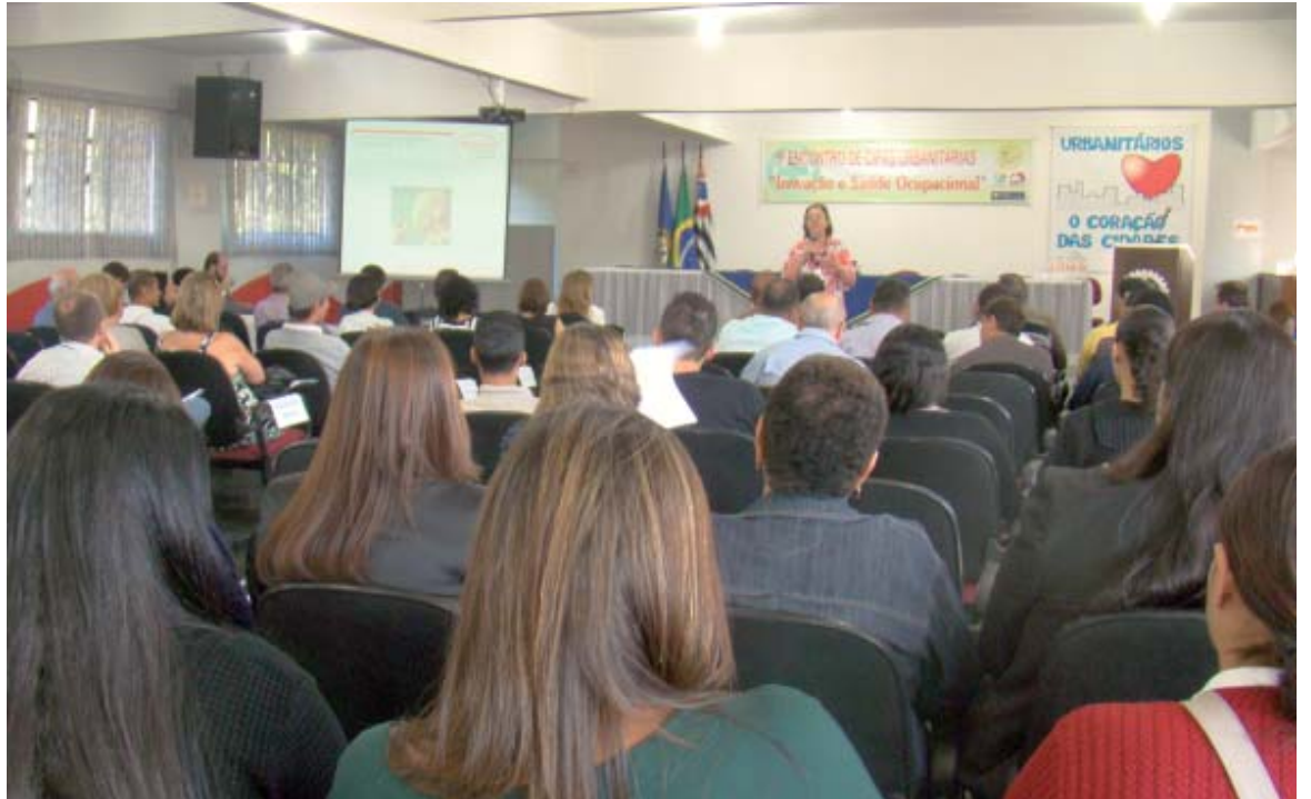
As informações citadas no evento ajudarão a fortalecer o trabalho dos cipeiros da nossa categoria