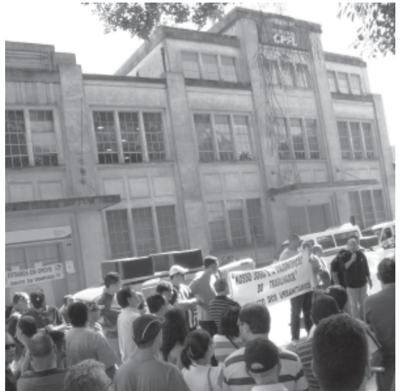
Unidade ao fundo será leiloada este mês. Sintius cobra explicações