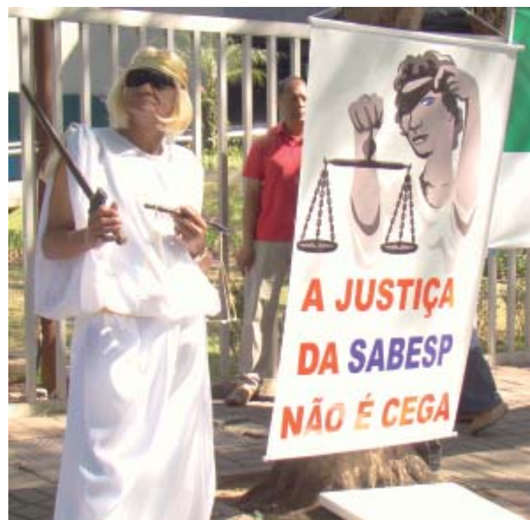
Com ironia, Sintius protestou contra as injustiças da empresa

“Ao tomar essa atitude, a empresa desrespeita o próprio Código de Ética, que determina atuar respeitando a legislação e buscando o diálogo constante com as entidades representantes dos empregados”, ressaltou.