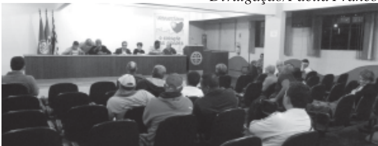
O Conselho Popular terá a participação de integrantes do Sintius