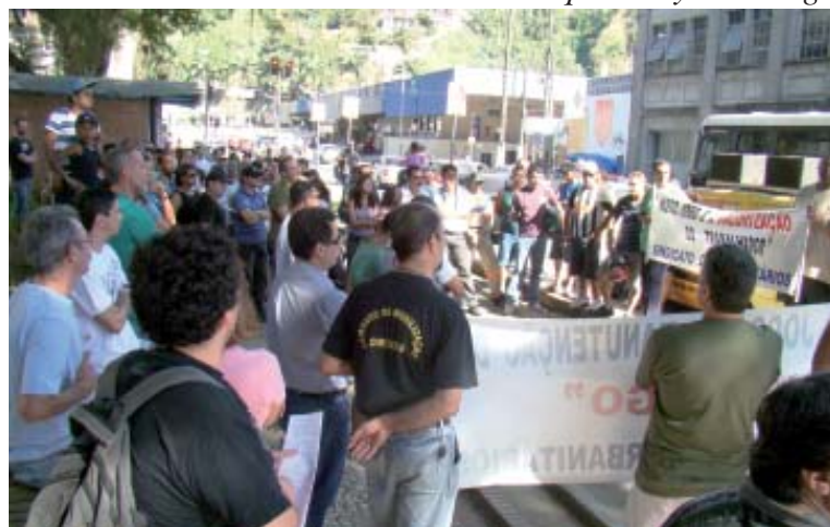
No ano passado, a categoria cruzou os braços por sete dias

No mesmo dia, será realizada assembleia na nossa sede, às 18 horas, para deliberar greve a partir da zero hora do dia 16. Se a negociação não avançar, a categoria vai parar!