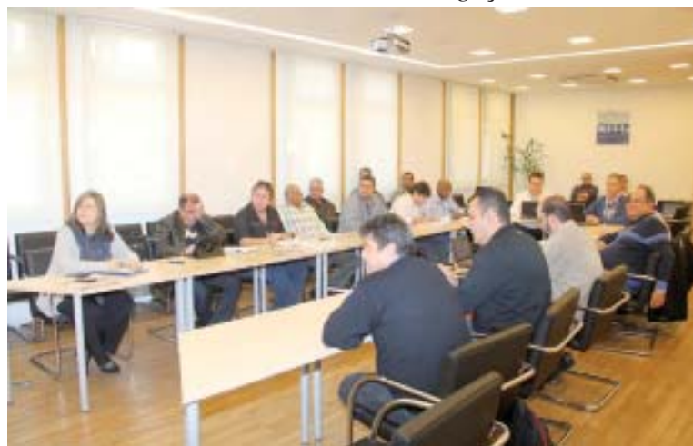
A reunião de negociação da empresa ocorreu em Cabreúva

Na avaliação do nosso sindicato, a proposta ainda não contempla os anseios da categoria, destacando prin-