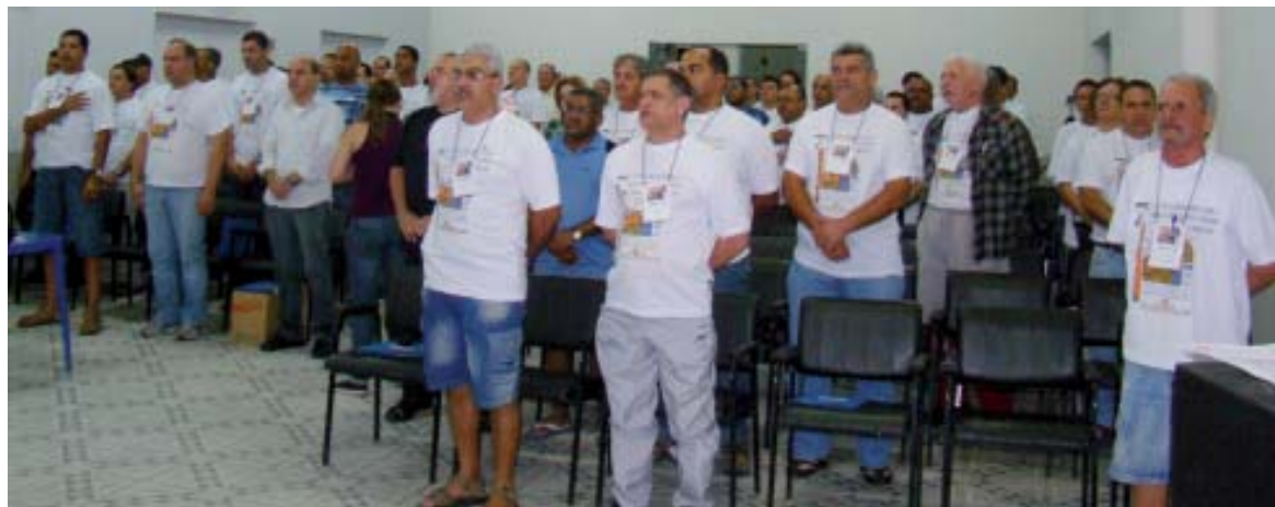
Marcado por importantes debates, o último Congresso dos Urbanitários foi realizado em 2009