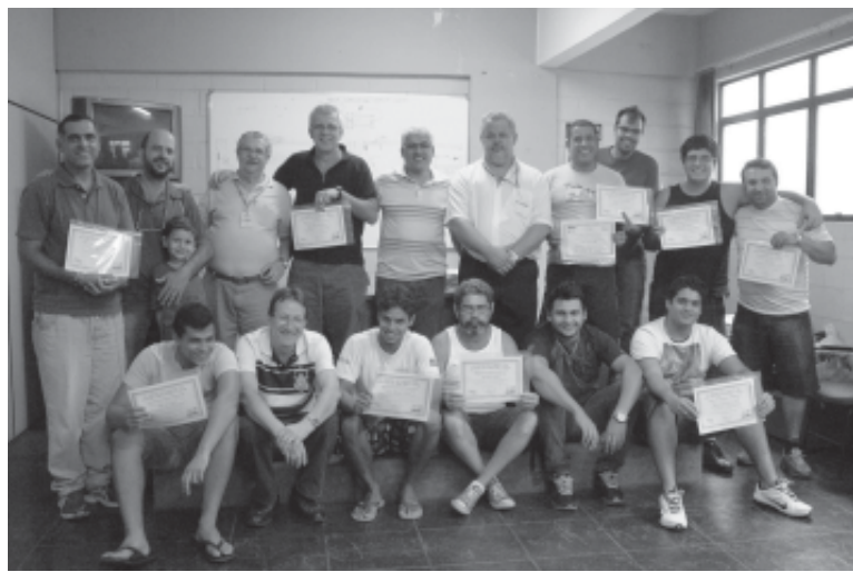
Gratuito, o curso realizado no nosso sindicato formou 13 alunos