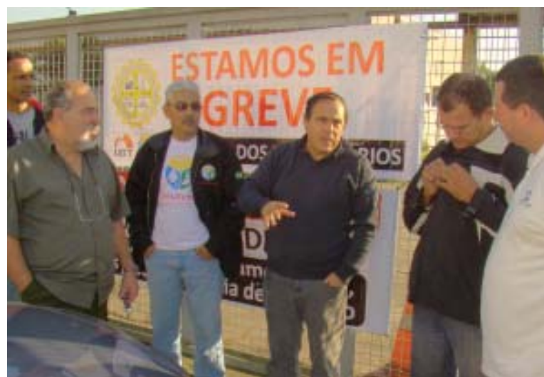
Devido ao impasse nas negociações, categoria fez greve de 24 horas

As horas extras executadas aos sábados, assim como nos domingos e feriados, serão pagas aos trabalhadores com 100%.