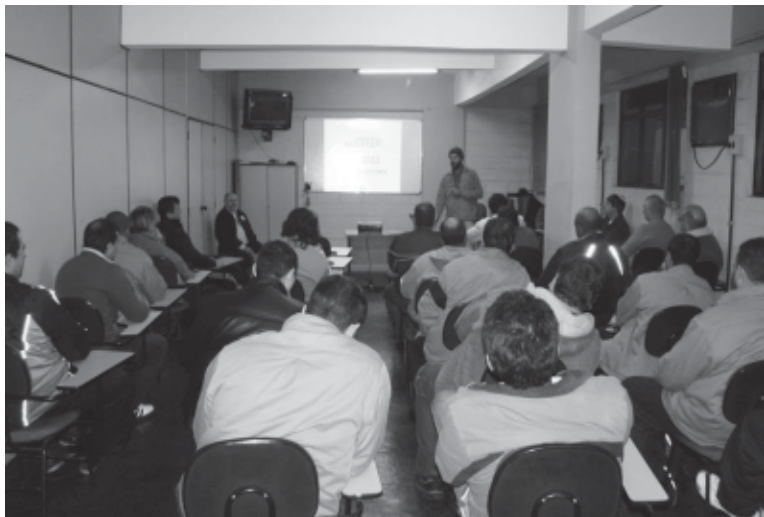
Sindicato realiza assembleia com trabalhadores da Cteep