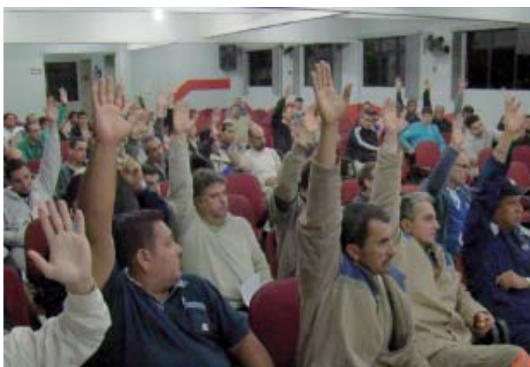
Maioria dos trabalhadores foi favorável à proposta da empresa

Outra conquista importante foi a nova redação da cláusula da PLR (Participação dos Lucros e Resultados).