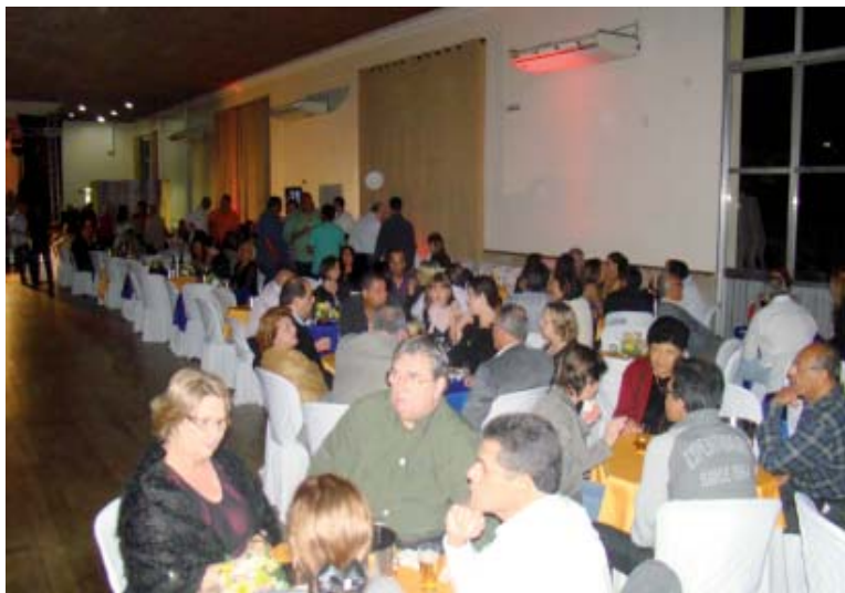
O evento foi uma grande oportunidade para os urbanitários colocarem o papo em dia com os amigos e se divertirem com a família

“Agradeço a todos pela presença em mais um tradicional Baile da Primavera promovido pelo Sintius. Hoje, além de ser um momento de confraternização entre a categoria urbanitária, gostaria também de comemorar o grande marco da política nacional. Estamos comemorando os 25 anos da nossa