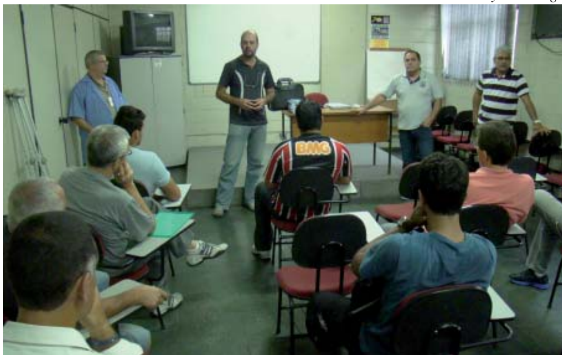
O curso atende gratuitamente 16 alunos. As aulas acontecem diariamente na sede do Sindicato