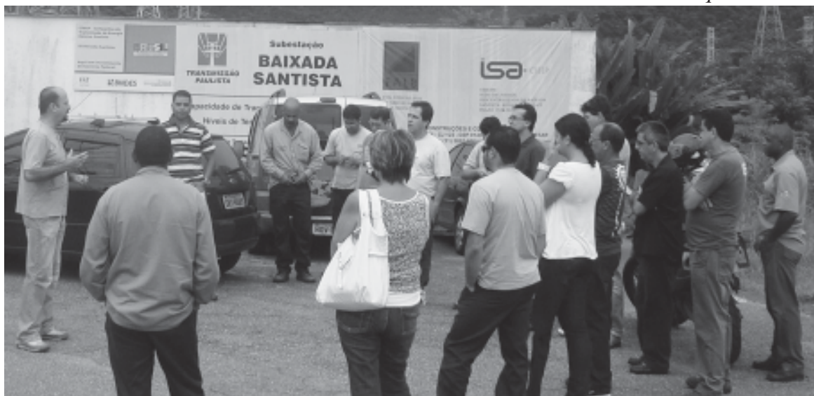
A reunião foi solicitada pelo Sintius, com base nos problemas recentes trazidos pela categoria

Para a diretoria do Sintius, a redução no tempo entre a troca de turnos pode ocasionar um risco quanto à segurança nos procedimentos normais e comuni-