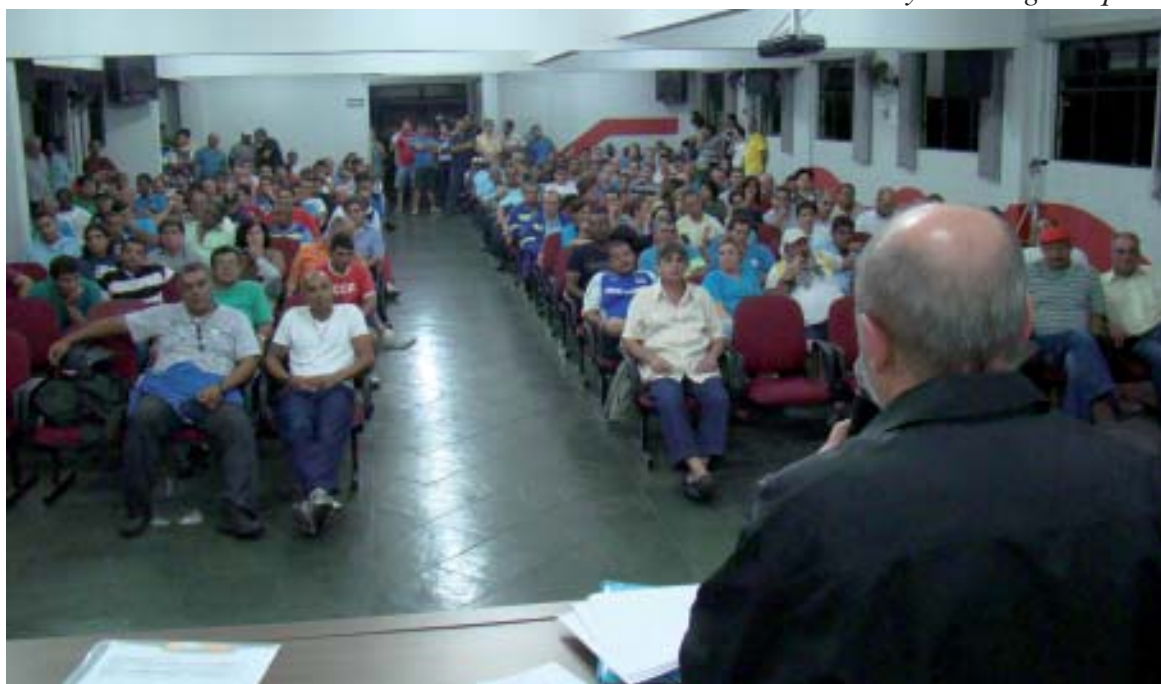
A criação do novo Plano de Cargos e Salários é uma antiga reivindicação da nossa diretoria

Em 2013, vamos retomar a batalha pelo aperfeiçoamento do PCS de tal forma que os trabalhadores sintam-se melhor contemplados.