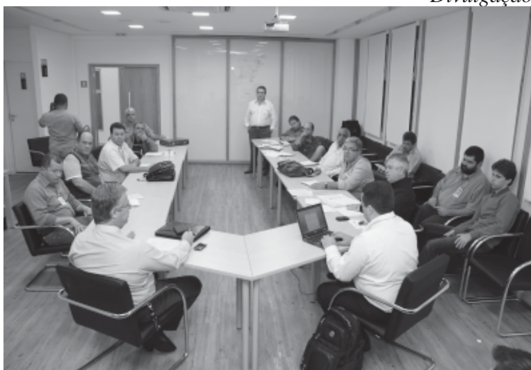
O Sintius participou de seis rodadas de negociação com a empresa

Após seis rodadas de negociação, a categoria obteve um reajuste salarial de 6%, sendo 1,73% de aumento real, já que o índice da inflação do IPC-Fipe ao longo do último ano foi de 4,19%. Além disso, o vale-refeição e o auxílio-alimentação terão um reajuste de 10%.