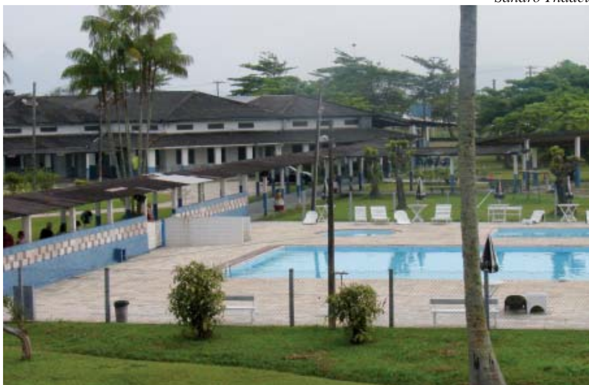
A Colônia de Férias de Caraguatatuba está à disposição da categoria para a realização de festas

Quem tiver interesse em se hospedar na nossa Colônia de Férias deve entrar em contato com a secretaria do Sintius pelo telefone 3226-3200, em horário comercial. Mais informações podem ser obtidas no site do Sintius ( www.sintius.org.br ).