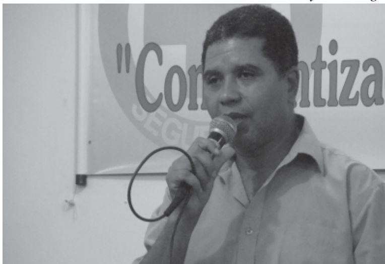
O diretor do Sintius Platini coordena o GT do Conselho Sindical