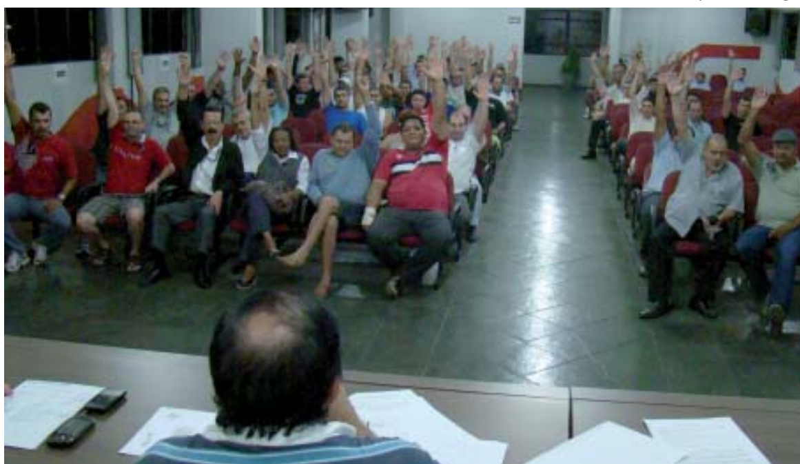
A greve da CPFL foi aprovada, por unanimidade, em assembleia realizada no dia 3 de julho

A CPFL recuou e o que foi acordado no MPT (abertura