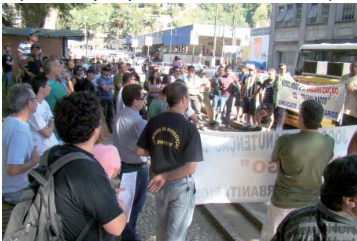
O Sindicato fez um ato público em frente à agência da empresa, em Santos, e entregou uma carta aberta à população para explicar os motivos dessa paralisação por tempo indeterminado

tura parcial das agências) foi devidamente cumprido, evitando assim transtornos à população, que teve conhecimento do nosso movimento pacífico por meio de uma