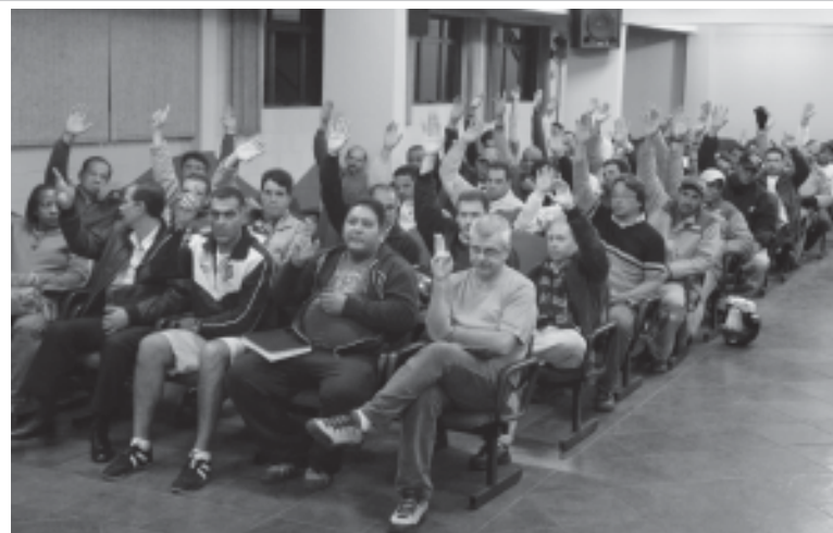
Em 28 de junho, o ACT foi aprovado, em assembleia, pela categoria

Vale destacar que após a categoria aprovar a proposta da CPFL, em assembleia realizada no dia 28 de junho, o ACT não foi assinado pelo Sindicato, porque houve uma divergência na redação da cláusula de emprego. Por esse motivo, houve um atraso no pagamento do reajuste.