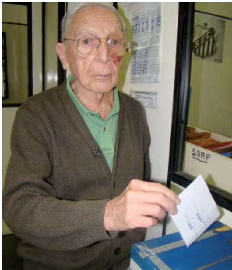
Pensionistas e aposentados participaram intensamente do pleito