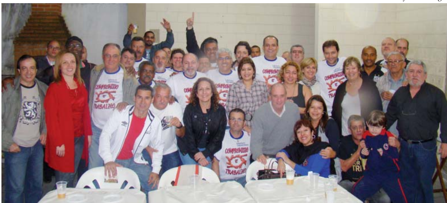
Mesários, colaboradores e diretores do Sindicato comemoraram muito o resultado da eleição deste ano

Durante esses dois dias de pleito, houve muita movimentação nos locais de votação. Em alguns lugares, como na unidade do Saboó, a maioria dos vo-