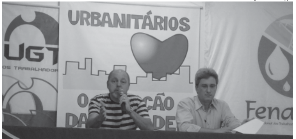
A reunião com os representantes da empresa no Sindicato ocorreu no dia 23 de novembro

Embora a apresentação da PLR trazida pelo superintendente aponte o cumprimento das metas, o Sindicato está preocupado com os índices referentes a “Perdas de Faturamento” e “Ações em Tratamento de Esgoto”, uma vez que decreto do Governo do Estado estabelece