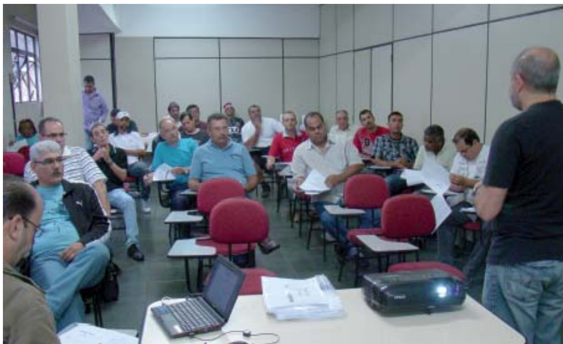
Nova diretoria se reuniu pela primeira vez para debater e planejar as atividades para o mandato

O Sintius seguirá participando ativamente dos diversos fóruns e conselhos de políticas públicas e buscará parcerias para subsidiar atividades de esporte, cultura e lazer.