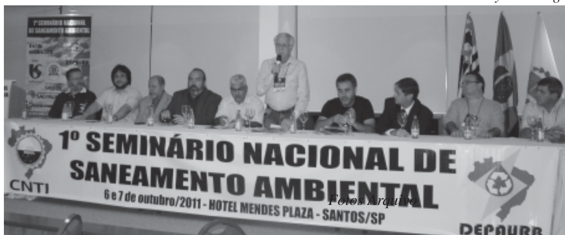
O 1º Seminário Nacional de Saneamento Ambiental do Depaurb, em Santos, foi considerado um sucesso

Além dos eventos e debates, a nossa diretoria mantém contato constante e direto com representantes de órgãos importantes, como Ministério do Trabalho e Emprego, prefeituras e casas legislativas.