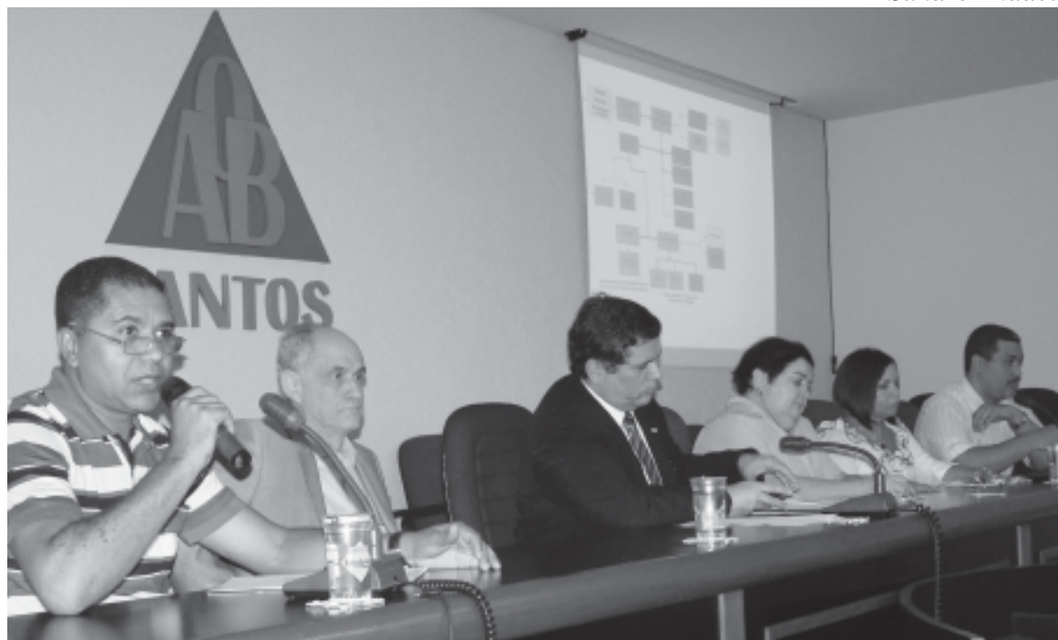
O Conselho Sindical Regional é um dos principais fóruns de discussão do mundo do trabalho