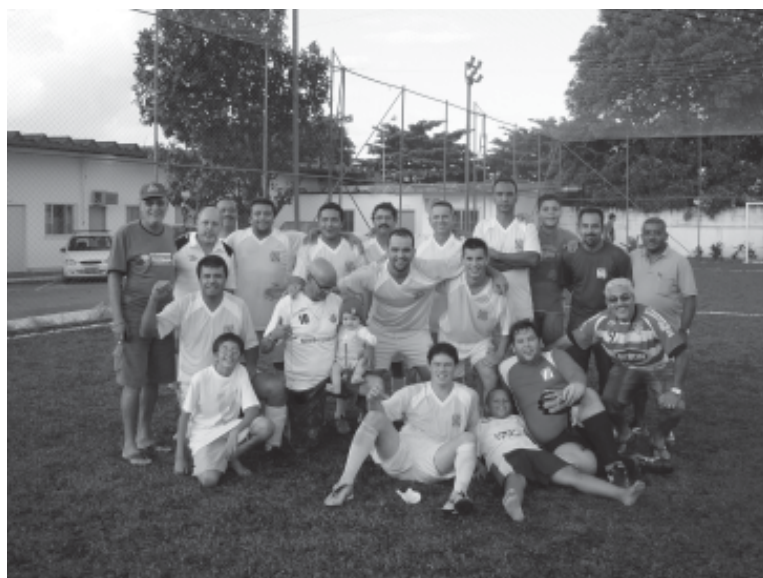
O Leão do Vale, formado por funcionários da Sabesp do Vale do Ribeira, foi o campeão do 2º Torneio de Futebol Society

Uma dessas ações foi o 2º Torneio de Futebol Society do Sintius, disputado na Associação Sabesp, na Ponta da Praia. Espírito esportivo e disposição não faltaram aos participantes.