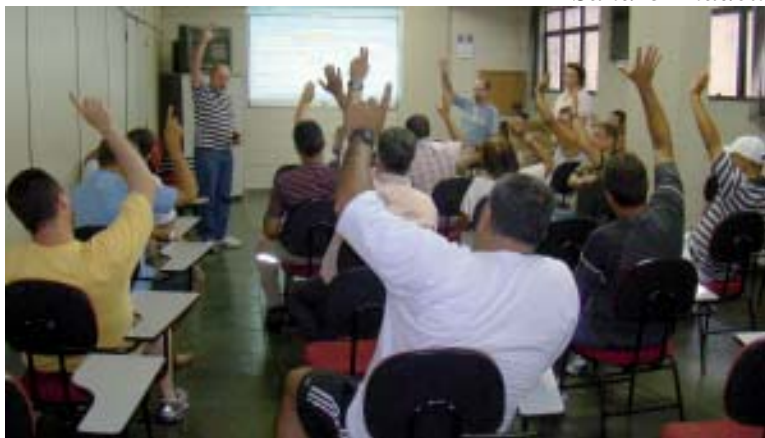
O equilíbrio das contas do Sintius é uma das metas da Diretoria

Os trabalhadores aprovaram, por unanimidade, a previsão orçamentária do Sintius para o próximo ano em assembleia realizada na nossa sede, no dia 30 de novembro.