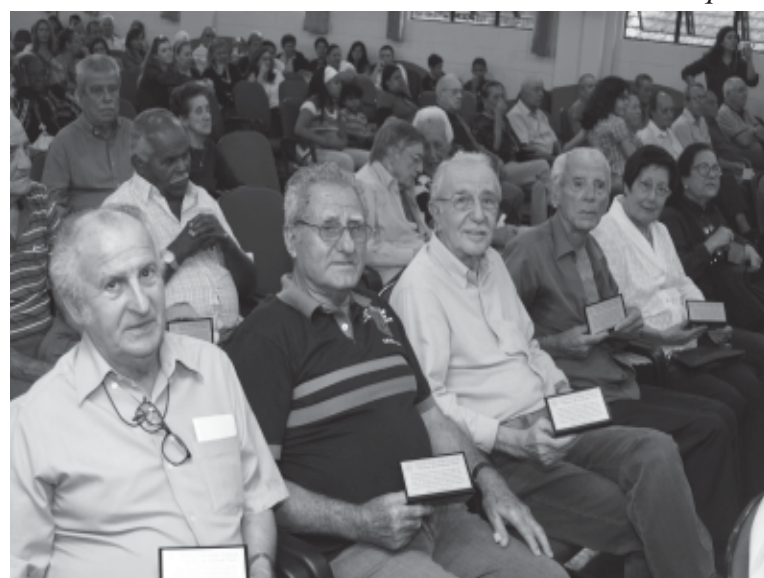
Um dos momentos marcantes foi a entrega do Troféu Narciso de Andrade Neto a aposentados e pensionistas da categoria

Outro importante evento deste ano foi a entrega do Troféu Nar-