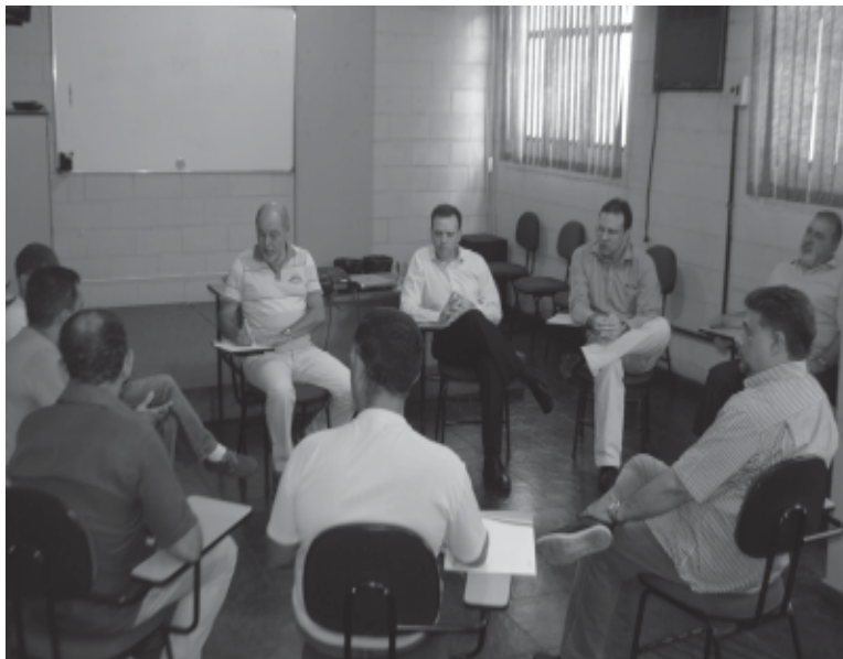
A reunião com representantes da empresa ocorreu em 27 de janeiro

O terreno da EA Santos também será negociado em fevereiro e a averiguação de áreas para a construção da nova EA já está sendo feita. Em ambos os casos, a CPFL garante a manutenção dos trabalhadores envolvidos nessas atividades.