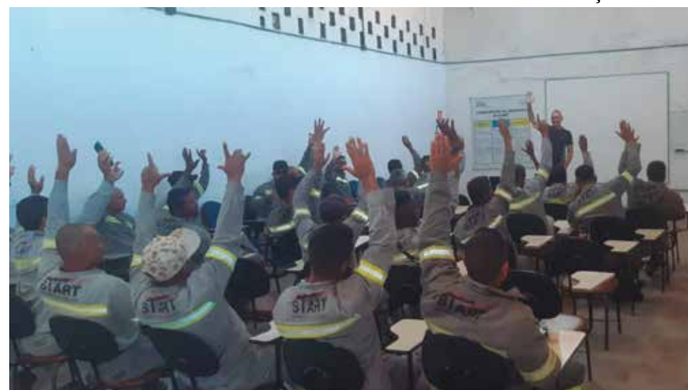
Trabalhadores da Start Engenharia querem aumento real para os benefícios

Além disso, consta na pauta outras medidas importantes, como o reajuste da função acessória de 5%