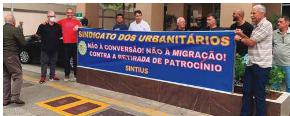
A Diretoria do Sintius está empenhada nessa luta em defesa dos eletricitários

O Sintius tem feito parte dessa luta constante contra a conversão, migração e retirada de patrocínio dos planos PSAP da Vivest. A Diretoria tem participado de uma série de ações e atividades nos planos jurídico, político e institucional para defender os interesses dos companheiros do setor de energia.