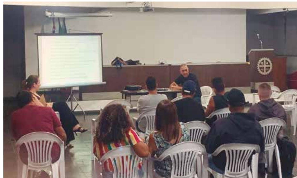
A assembleia com os trabalhadores da CPFL ocorreu no dia 20 de abril