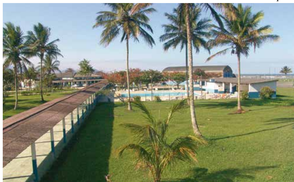
A nossa colônia de férias fica de frente para a Praia do Romance